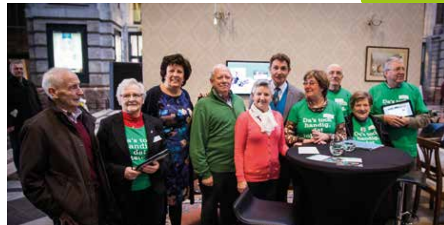
campagne Da's toch handig dat Internet

De Jongerenmediadag , in samenwerking met het Kenniscentrum Mediawijsheid (Mediawijs.be) en Villa Crossmedia, een Europees project rond mediawijsheid stond in het teken van media maken voor en door jongeren. Zowel jongeren als organisaties die met jongeren werken en professionele mediamakers namen deel.