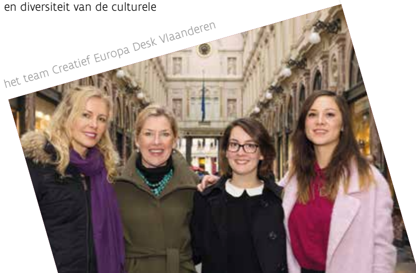
het team Creatief Europa Desk Vlaanderen