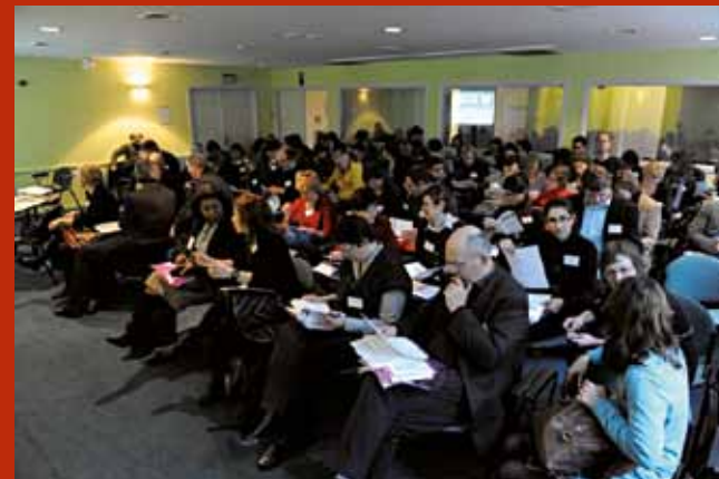
Presentatie VLIR-rapport Gelijke Kansen en Diversiteit 2010