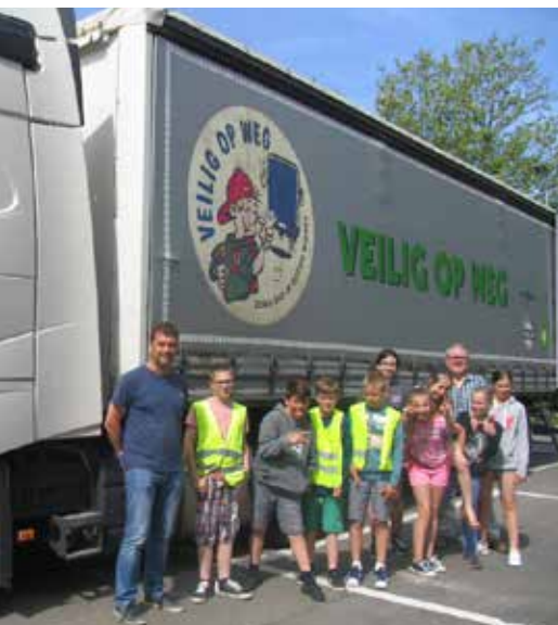
Met 'Veilig op weg' geeft Zemst in 3 dagen 300 leerlingen les over de dode hoek.

In Zemst organiseren de gemeente en de lokale politie al twee jaar dodehoeklessen voor alle zesdejaars van de acht basisscholen. De mobiliteitsambtenaar geeft de theorie, de politie begeleidt de praktijklessen. Daarvoor gebruiken ze het draaiboek en de lespakketten 'Veilig op weg' van Transport en Logistiek Vlaanderen (TLV).