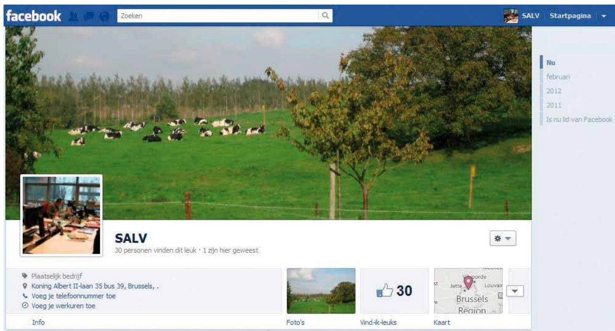
Figuur 5 - De SALV-Facebookpagina maakt melding van onze adviezen en toont foto's van onze activiteiten zoals het SALV-event.

VILT, Vlaams Infocentrum Land- en Tuinbouw ( www.vilt.be ), pikt regelmatig adviezen van de SALV op en publiceert hierover artikels. Dankzij het grote bereik van de dagelijkse nieuwsbrief "VILT nieuwsoverzicht" bereiken onze adviezen een grote groep geïnteresseerden in landbouw en visserij.