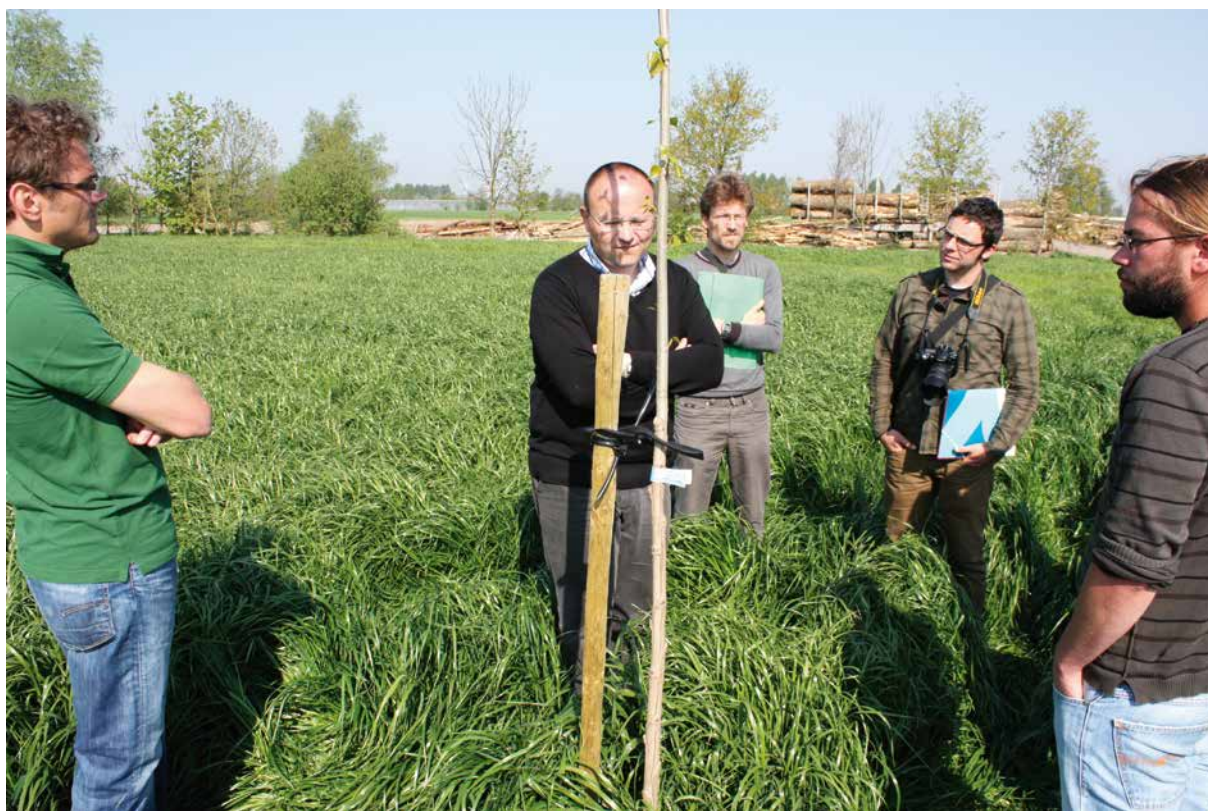
Figuur 7 - De SALV bezoekt het agroforestry-project van Groep Mouton in Lochristi.

De steunaanvraag voor controlekosten voor biologische productie werd opgenomen in de verzamelaanvraag.