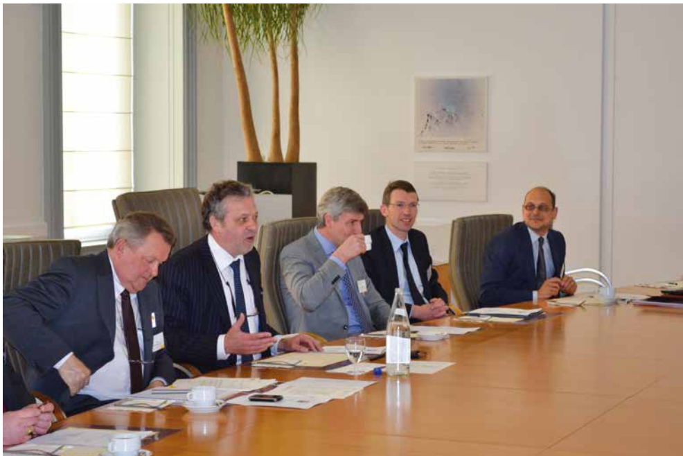
Figuur 4 - De SALV bezoekt de commissie Landbouw, Visserij en Plattelandsbeleid van het Vlaams Parlement

Buiten het beleidsdomein stelde de SALV zich voor op een bestuursvergadering van het Algemeen Boerensyndicaat en aan de commissie Landbouw, Visserij en Plattelandsbeleid van het Vlaams Parlement. Ook deze voorstellingsmomenten hadden als doel de bezochte instelling kennis te laten maken met de SALV en om de instelling beter te leren kennen.