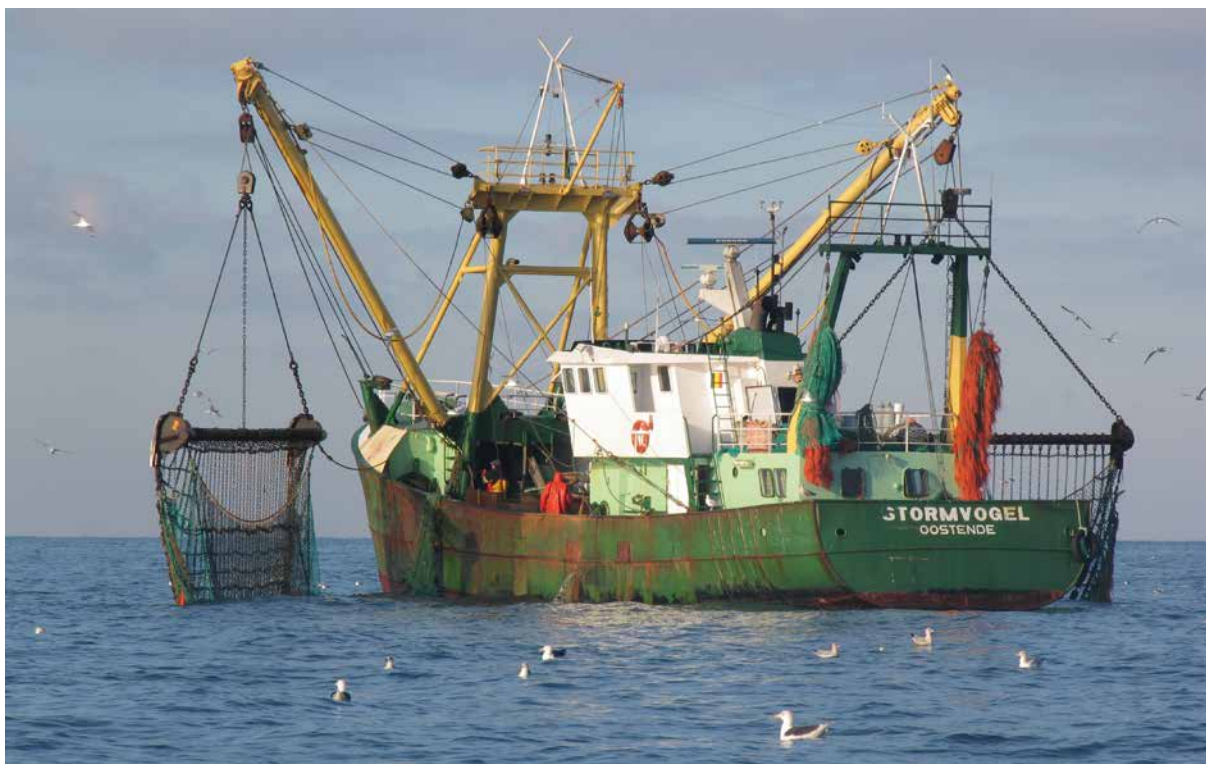
Figuur 8 - De O51 - Stormvogel

De Vlaamse Regering volgt de aanbevelingen van de SALV wat betreft de overgangperiode van toepassing van VMS en om de VMS-verplichting te beperken tot vissersvaartuigen met een lengte over alles van meer dan 12 meter. De Vlaamse Regering motiveert waarom de overige aanbevelingen niet gevolgd werden.