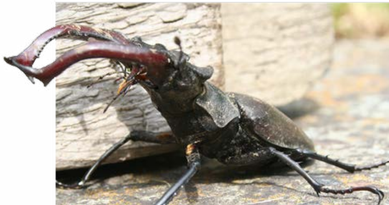
foto: Vliegend hert

In Overijse en Hoeilaart hebben meerdere bewoners taluds in hun tuin met oude treinbielzen verstevigd. In dat hout wonen vaak de larven van het vliegend hert, een van de grootste en zeldzaamste kevers in Europa. Maar meer mensen vervangen die treinbielzen door bijvoorbeeld beton. Zo verdwijnt stilaan een gedeelte van het leefgebied van dit bijzondere en kwetsbare diertje. Daarom geven we subsidies aan mensen die kiezen voor eikenhouten palen.