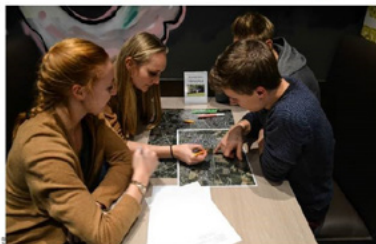
*Jongeren konden op de eerste 'Toogpraat' mee besluiten over het kindvriendelijk gebruik van openbare ruimten.