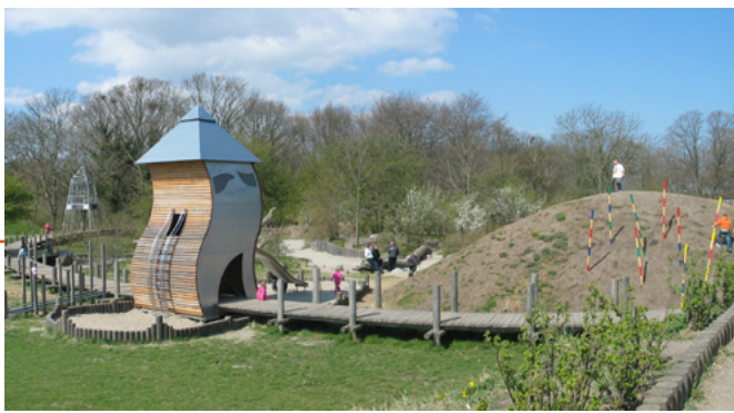
© Design en foto: Helle Nebelong