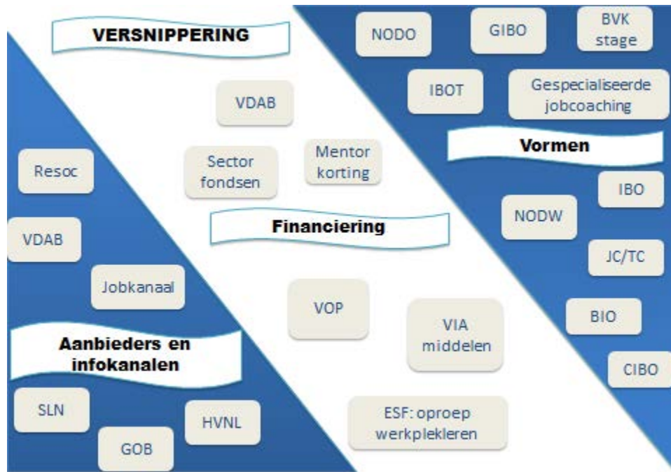
Figuur 4.1 Overzicht maatregelen

VDAB onderneemt als arbeidsmarktregisseur verschillende initiatieven om beter tegemoet te komen aan de noden van werkgevers (bv. servicepunten en accountmanagers). Toch geven werkgevers aan dat er soms weinig overschrijdend gewerkt wordt waardoor werkgevers de weg moeten vinden tussen de verschillende diensten. In dit opzicht wordt aangehaald dat elkaars aanbod niet altijd kennen en verwijzen niet altijd naar elkaar door. Er wordt daarnaast gesignaleerd dat VDAB sommige maatregelen sterk promoot zoals bijvoorbeeld IBO, voor andere maatregelen is er dan eerder sprake van ‘onderpromotie’ (bv. beroepsverkennde stage). Tenslotte merken werkgevers op dat op de huidige website van VDAB de accountmanagers moeilijk vindbaar zijn.