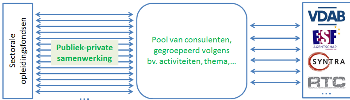
Figuur 2: Publiek-private samenwerking via platformteams van consulenten