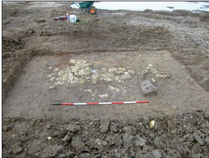
Fig. 7 Een stuk van een haardplaat en wat muurresten verwijzen naar een constructie.

Zone B. Ten westen van de Komenbeek werd een woonzone herkend. Een haardplaat en stroken baksteenpuin wijzen alleszins op een gebouw; een vakwerkconstructie, opgetrokken op baksteenbasissen (fig. 7). De haardplaat meet 1,4 op 1 m en lijkt in de hoek van de constructie te liggen. Enkele stukjes muurbasis bestaan uit baksteenpuin. Vooral gele baksteen werd gebruikt (26 x 12,5 x ?; 22,5 x 11 à 11,5 x ?; 22 x 12 x ?). Er zitten ook natuursteenblokken tussen, die als poeren/steunpunten binnen het gebouw kunnen geïnterpreteerd worden.