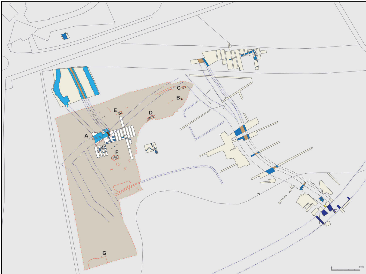
Fig. 4 Geregistreerde zones binnen het geheel van het opgegraven terrein.

Het veldwerk werd uitgevoerd op 22-25/09/2009 en 21-22/10/2009 1 . Het bleef beperkt tot een oppervlakkige registratie (fig. 4).