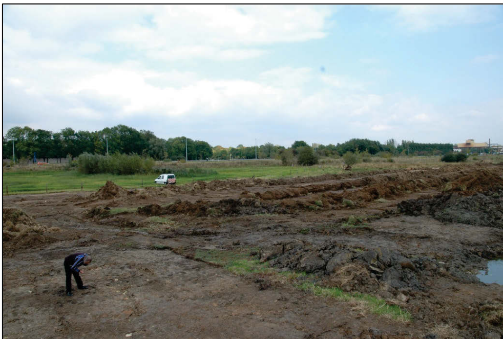
Fig. 1 Ook bij afplagging kunnen archeologische sporen opduiken.

Op 15 september 2009 werd gemeld dat er bij het afplaggen toch archeologische sporen oppervlakkig aan het licht kwamen en werd de toevalvondstprocedure in gang gezet. Jan Decorte van Archeo7 speelde hier een actieve rol in.