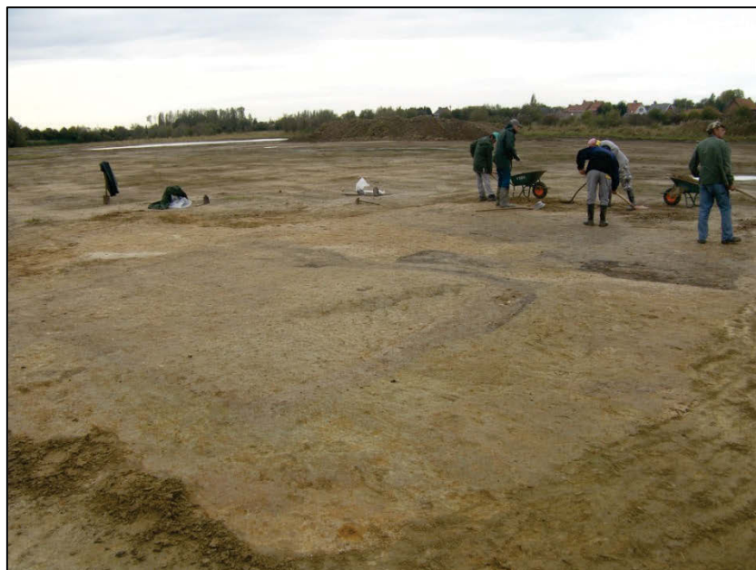
Fig. 11 Overzichtsfoto van de kuilenzone.

Zone G. Ook oorlogsresten mochten niet ontbreken. Zo werd o.a. een kist met Britse granaten gevonden (fig. 12). De huls, gevuld met kruit en bedoeld om ze af te schieten, zit er nog op.