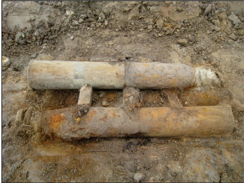
Fig. 12 Britse granaten, transportklaar.

Bij het opschonen van de sporen kon heel wat schervenmateriaal verzameld worden. Door de inzet van een metaaldetector kwamen ook gespen, een zilveren munt en een penning, een miniatuurgrape, een riemtong, een mesblad (met merkteken), een lakenloodje een vogelrinkbakje en veel smeltlood aan het licht.