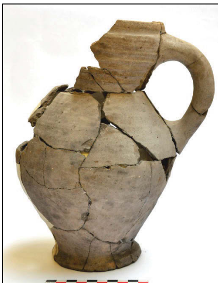
Fig. 6 Een volledige grijze kan, 2 de helft 13 de eeuw .

Zone A. In een voormalig opgravingsvlak zijn een tiental palen van een voorheen al geregistreerde brug en beschoeiing uit hun context gerukt. Dit bood de gelegenheid om houtstalen te nemen in functie van eventueel dendrochronologische analyse. Van de 16 palen konden er 6 gedateerd worden 2 . Uit dit materiaal kwamen 2 curves naar voor. De ene ligt zeker ná 1279, de andere zeker na 1352, maar vóór 1368. Uit vroegere studie 3 blijkt dat het in de periode 1280-1290 in dit deel van de Sint-Michielsparochie uitermate druk was (bouw houten gebouwen, aanleg beschoeiing Ieperlee). De tweede periode wijst op herstellingen van de brug. De laatste piekperiode van de muntcirculatie is trouwens te plaatsen van 1360 tot 1365. Bij het vergroten van de put kwam een muurtje vrij en zijn nog andere vondsten tevoorschijn gekomen o.a. een volledige grijze kan (fig. 6).