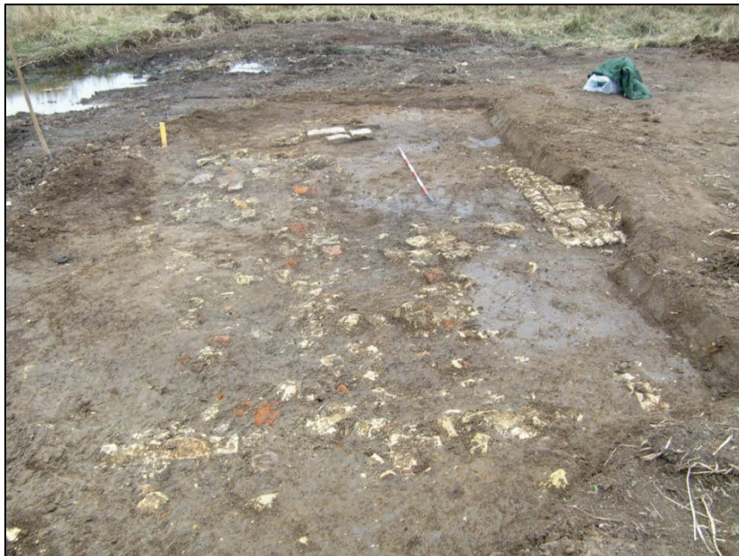
Fig. 9 Overzichtsfoto van zone C.

Zone D. Hier valt een 1,25 tot 2,5 m brede greppel op, waarin veel scherven steken. De greppel loopt parallel (ten zuiden) met de verbindingsgracht tussen de Ieperlee, de Nieuwe Leye en de Komenbeek. Is dit een aanduiding voor het verloop van een weg erlangs?