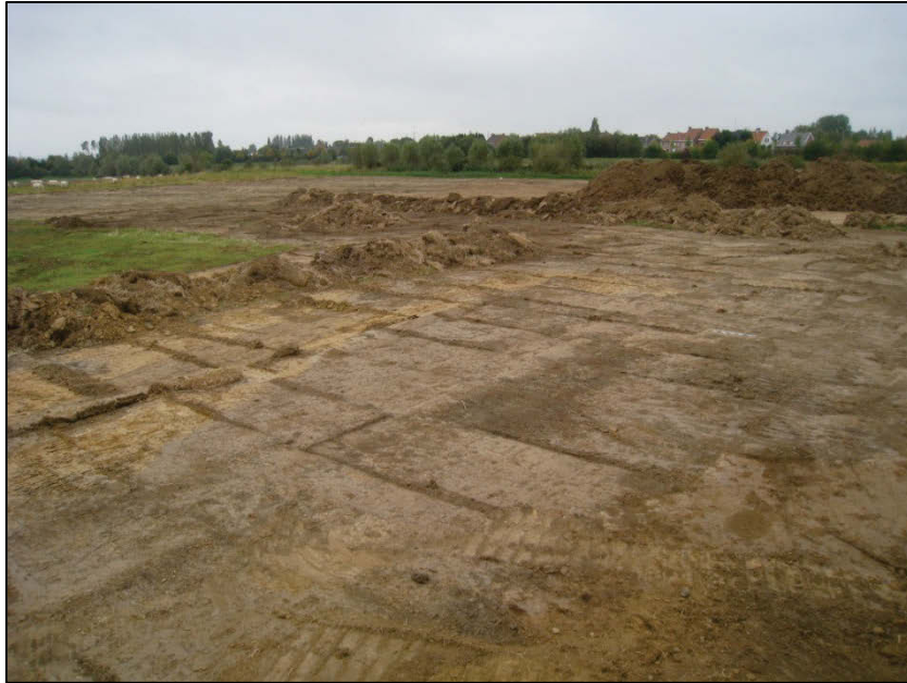
Fig. 5 De verkleuring van de gegraven waterloop, die de verbinding maakt tussen de Ieperlee, de Nieuwe Leye en de Komenbeek is prominent aanwezig.

Zone A. In een voormalig opgravingsvlak zijn een tiental palen van een voorheen al geregistreerde brug en beschoeiing uit hun context gerukt. Dit bood de gelegenheid om houtstalen te nemen in functie van eventueel dendrochronologische analyse. Van de 16 palen konden er 6 gedateerd worden 2 . Uit dit materiaal kwamen 2 curves naar voor. De ene ligt zeker ná 1279, de andere zeker na 1352, maar vóór 1368. Uit vroegere studie 3 blijkt dat het in de periode 1280-1290 in dit deel van de Sint-Michielsparochie uitermate druk was (bouw houten gebouwen, aanleg beschoeiing Ieperlee). De tweede periode wijst op herstellingen van de brug. De laatste piekperiode van de muntcirculatie is trouwens te plaatsen van 1360 tot 1365. Bij het vergroten van de put kwam een muurtje vrij en zijn nog andere vondsten tevoorschijn gekomen o.a. een volledige grijze kan (fig. 6).