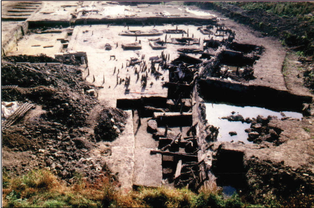
Fig. 3 1997: Zicht op de woonzone tussen de Ieperlee (rechts) en de Leggherstraat (links).

Het aanbod aan structurele sporen is overweldigend: plattegronden van huizen en ateliers, (al dan niet verharde) straten en bermsloten, (al dan niet beschoeide, natuurlijke of gegraven) waterlopen, bruggen, aanlegsteigers, ... Het vondstenspectrum is zeer gediversifieerd en bevat de gebruikelijke huisraad, maar ook wapens, werktuigen, kledij-accessoires, speelgoed, devotionalia, ... Ook ecologisch materiaal is overvloedig beschikbaar. Bot, zaden en vruchten, stuifmeel, ... kunnen de consumptiegewoonten gedetailleerd illustreren.