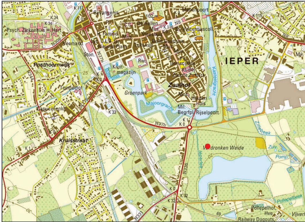
Fig. 2 Situering van de vindplaats.