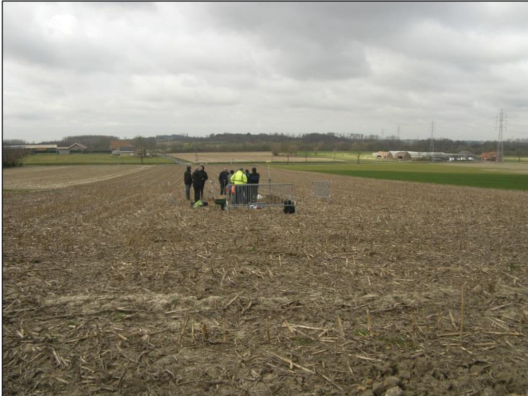
Fig. 2 Zicht op de vindplaats, genomen in westelijke richting, haaks op het kanaal Kortrijk-Bossuit.

De vindplaats bevindt zich halfweg op de westelijke helling van de Keiberg, een noord-zuid gerichte heuvelkam ten westen van Heestert, die maximaal 66 m hoog is.