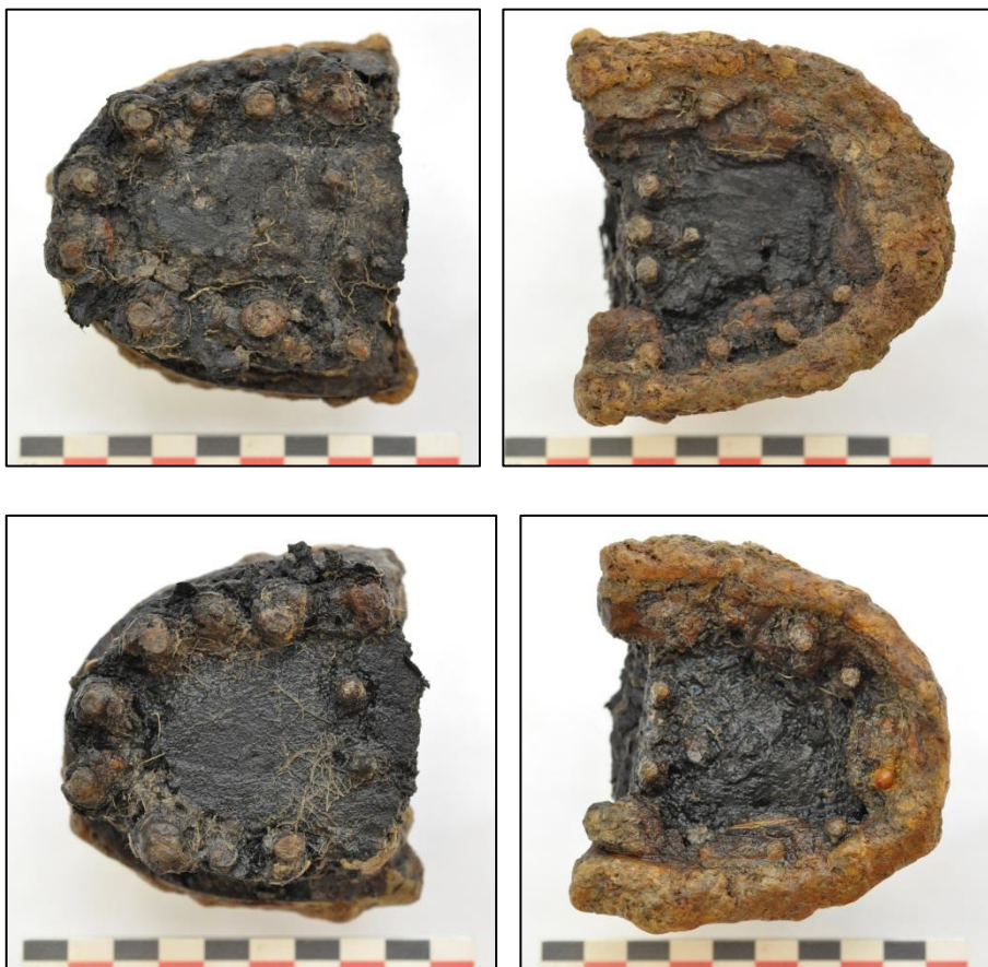
Fig. 10 Linker- en rechterhiel van de infanterieschoenen 'Infantry boot'.