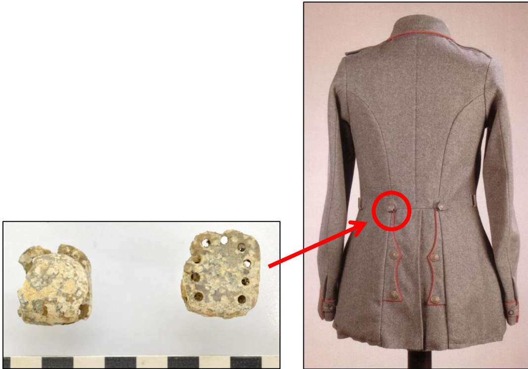
Fig. 7 Rughaak van de uniformjas (M13 Feldrock), waaraan de riem was vastgemaakt.