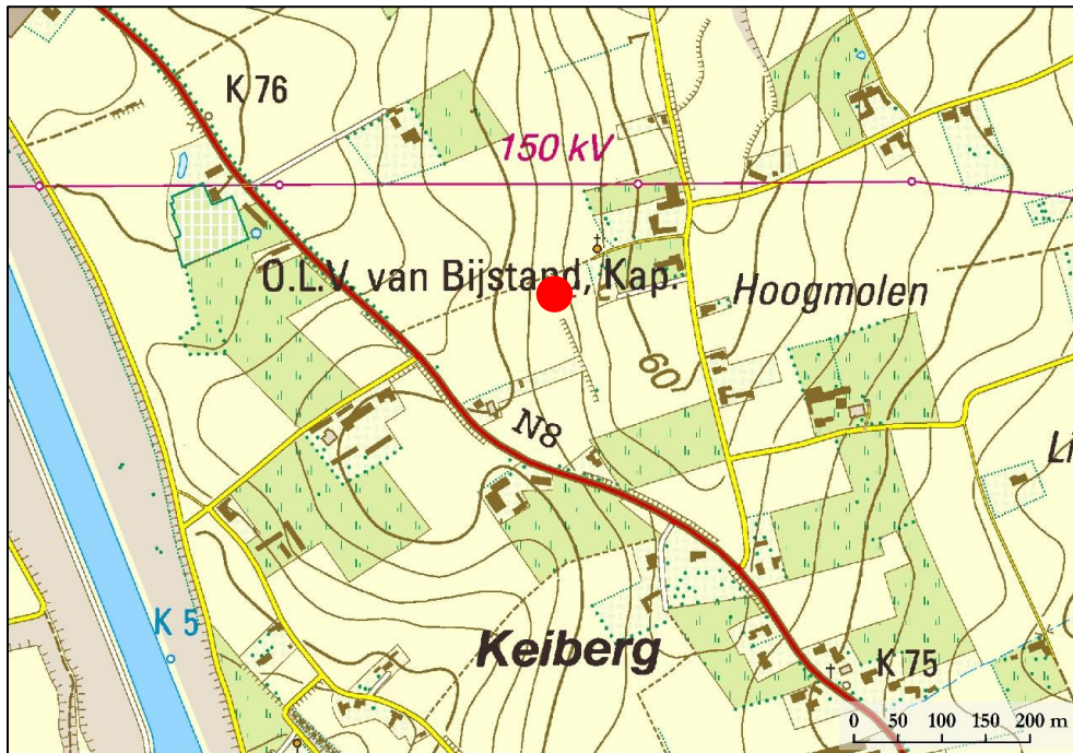
Fig. 3 Localisatie van de vondst op de topografische kaart.