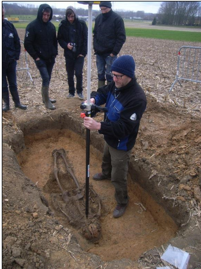
Fig. 1 Het agentschap Onroerend Erfgoed aan de slag.