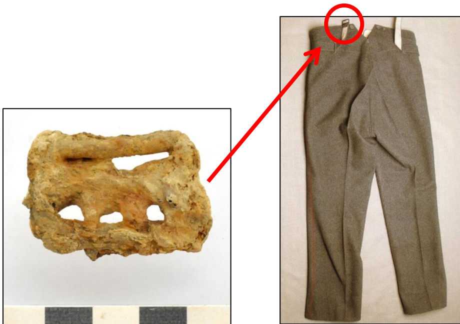
Fig. 9 Bevestigingsgesp voor een bretel aan de uniformbroek.