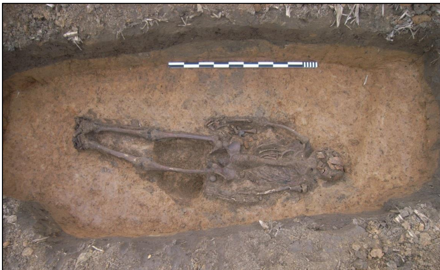
Fig. 6 De gesneuvelde was neergelegd in een obustrechter, aangegeven door de grijze vlekken in de geelbruine zandleem.

Zowel de mobiele vondsten als het botmateriaal werden grondig bestudeerd.