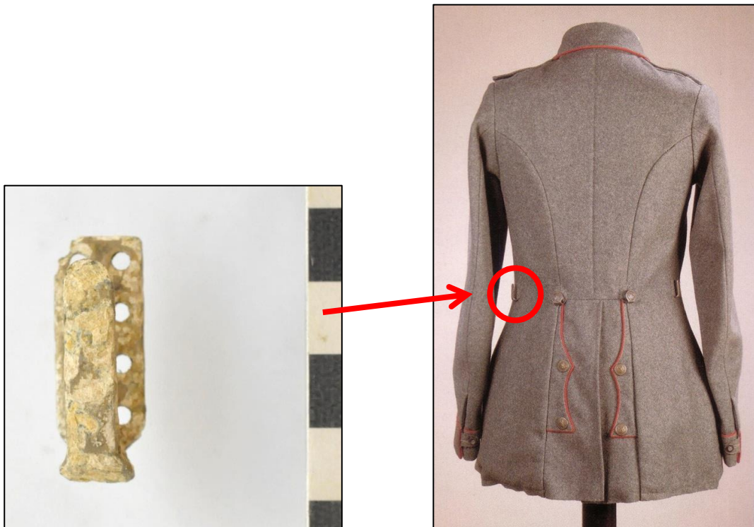
Fig. 8 Zijdelingse haak om de riem vast te haken aan de uniformjas (M13 Feldrock).