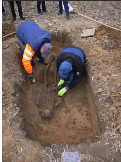
Fig. 5 Het agentschap Onroerend Erfgoed legt de resten volledig vrij.

Het overige vondstenmateriaal was schaars, wat erop wijst dat het lijk grondig gestript is, vooraleer het aan de grond is toevertrouwd. Dat is trouwens respectvol gebeurd