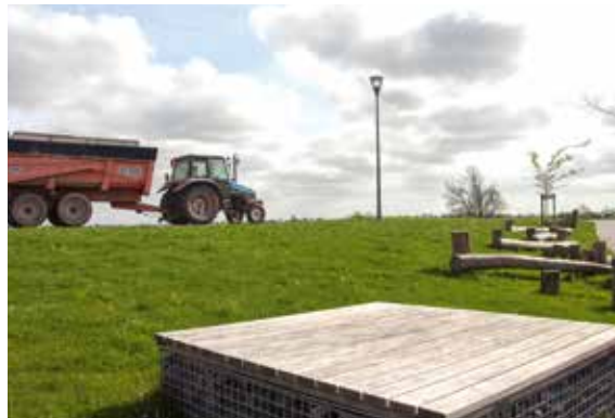
Grond kopen, verkopen en ruilen