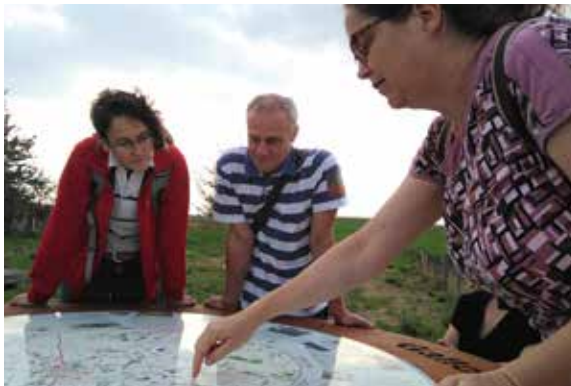
Een dynamisch open ruimte- en plattelandsbeleid