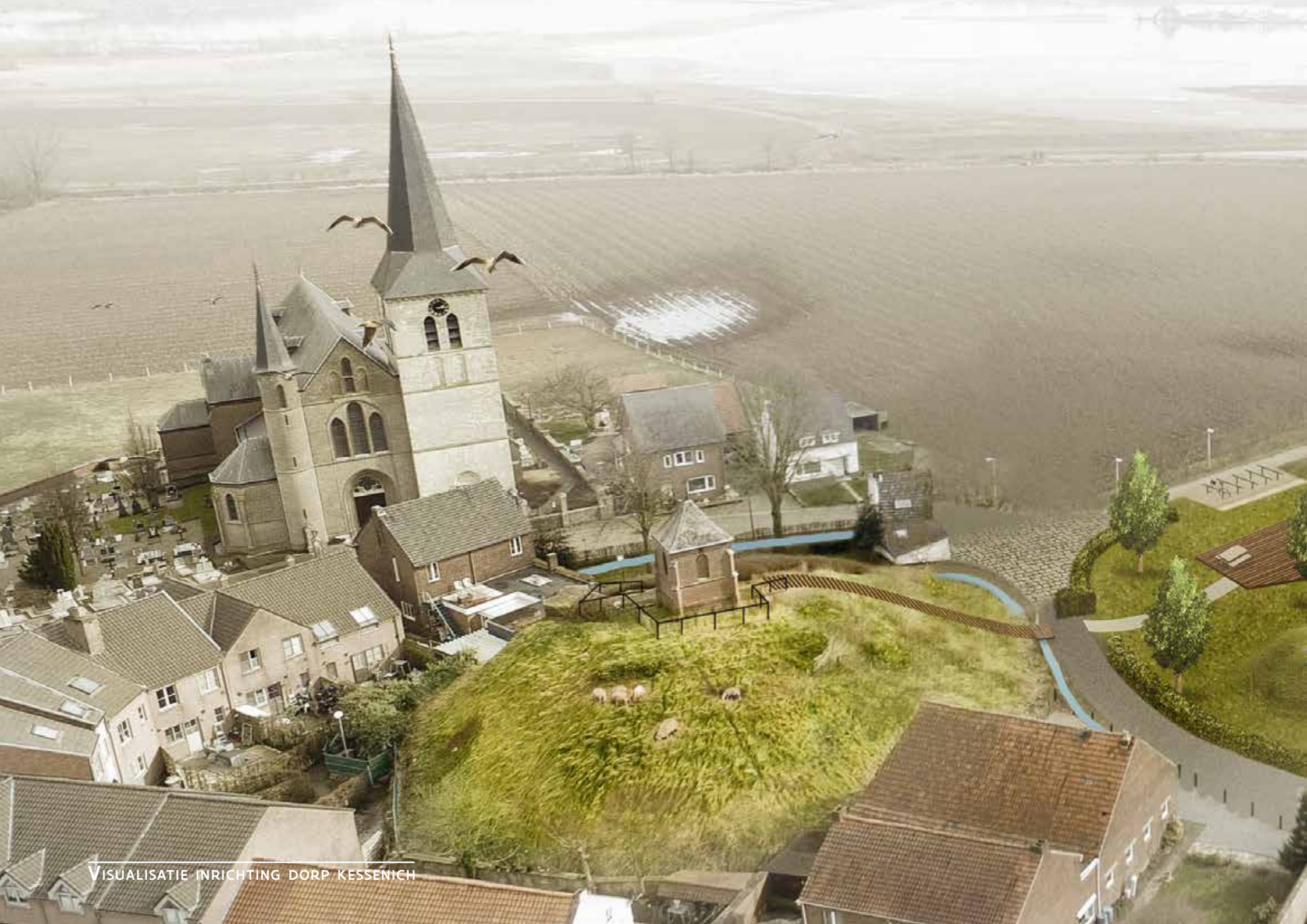
VISUALISATIE INRICHTING DORP KESSENICH