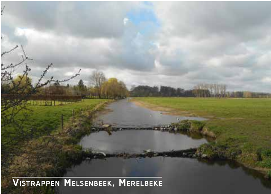
VISTRAPPEN MELSENBEEK, MERELBEKE