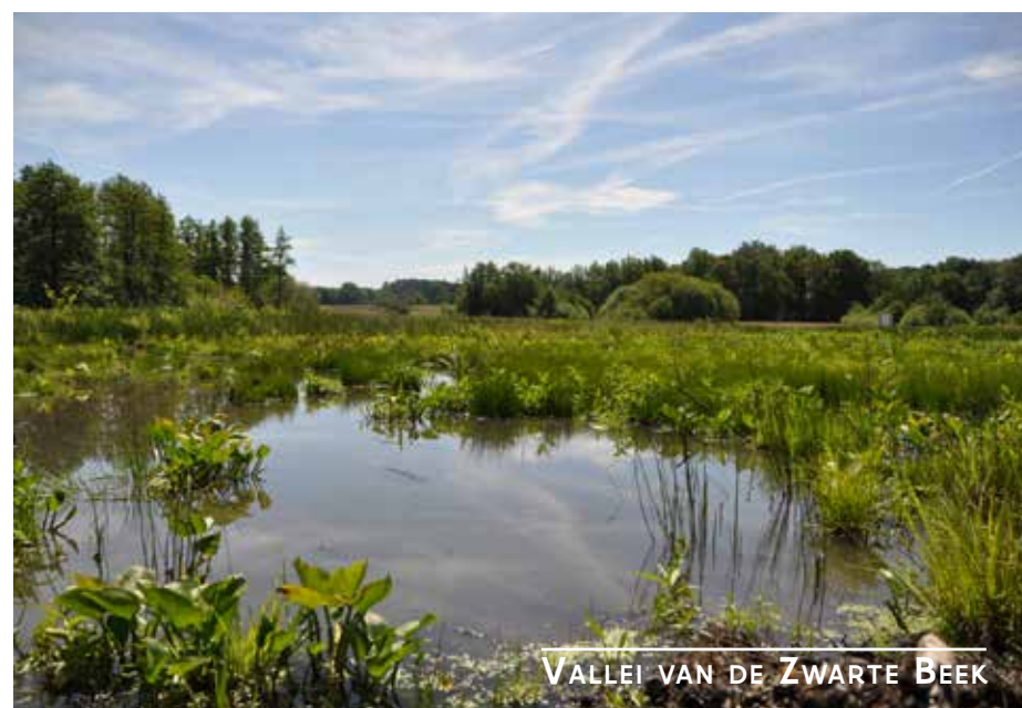
VALLEI VAN DE ZWARTE BEEK