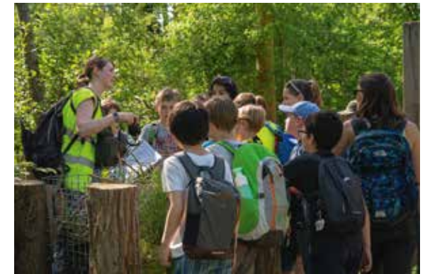
In ACTIE voor het klimaat