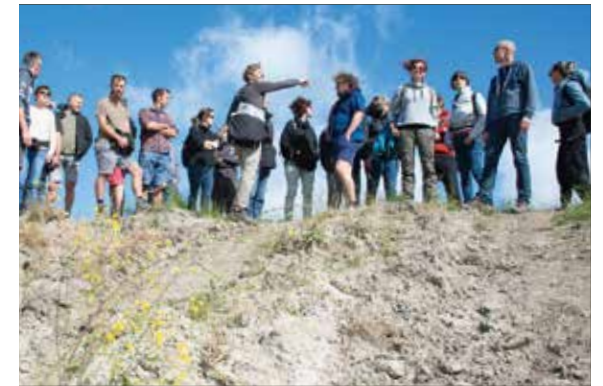
Wat maakt ons sterk?