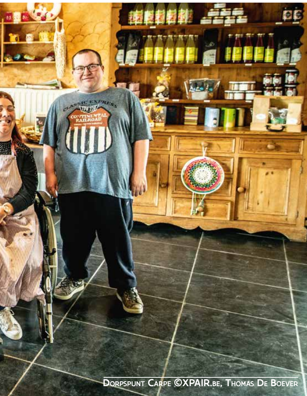
DORSPUNT CARPE