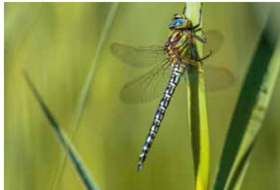
Waterlopen en landschappen vol leven