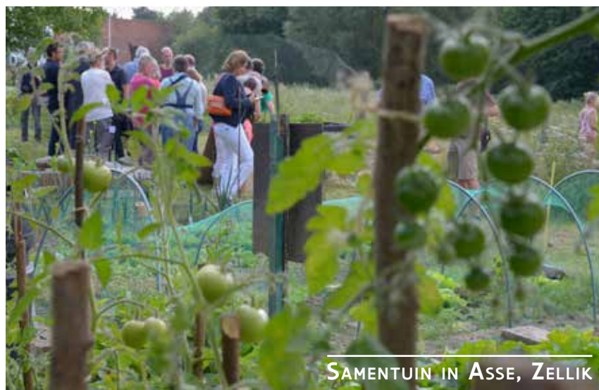
SAMENTUIN IN ASSE, ZELLIK

Sinds 2008 zijn voor de doelstellingen rond sociale cohesie, participatie en leefbaarheid in dorpen verschillende bottom-up initiatieven gestimuleerd en ondersteund. Voorbeelden daarvan zijn de Vlaamse Vereniging voor Dorpsbelangen, Dorpsateliers van Landelijke Gilden vzw en de projectoproep Buurten op den Buiten, in samenwerking met de Koning Boudewijnstichting. Daarnaast organiseert de VLM sinds 2017 de wedstrijd Dorpskracht. Een publicatie over het dorpenbeleid biedt lokale besturen manieren om concreet aan de slag te gaan. De inzichten en ervaringen uit de projecten, aangevuld met de informatie uit 3 dialoogdagen in 2017, zijn opgenomen in een advies over het dorpenbeleid in Vlaanderen. Dat kan in de komende regeerperiode verder uitgewerkt worden en tot nieuwe initiatieven leiden.