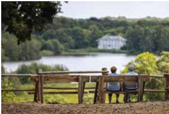
De open ruimte inrichten