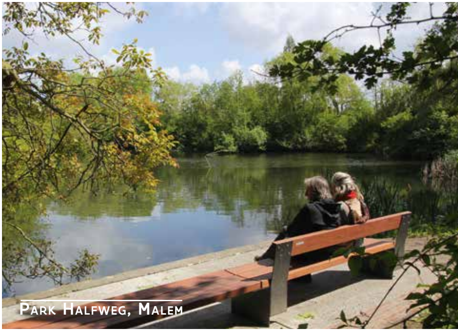
PARK HALFWEG, MALEM