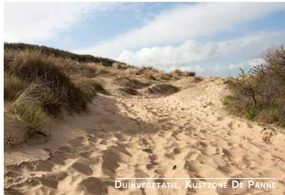
DUINVEGETATIE, KUSTZONE DE PANNE