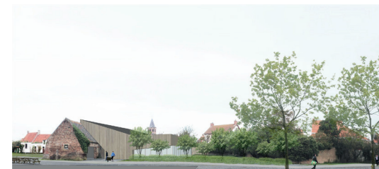
@tussengoeid architectuur - stedenbouw & ba-p bureau voor architectuur en planning

Na de planvormingsfase kan de nieuwe eigendomsituatie vastgelegd worden in een akte en kunnen de terreinwerken beginnen. Daarna zal de gemeente de meerwaarde die ze realiseert als betrokken eigenaar, gebruiken om te investeren in de restauratie van de hoeve en de omvorming tot dorpsontmoetingscentrum. De private eigenaar kan dan ook de woonzone inrichten.