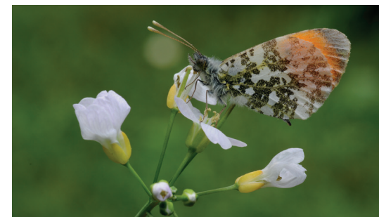
Oranjetipje - Staf De Roover

We mikken erop dat enkele tientallen private grondgebruikers mee zorgen voor de verdere ontwikkeling van dieren- en plantenpopulaties in De Merode, zodat een groen netwerk tussen de natuurgebieden ontstaat.