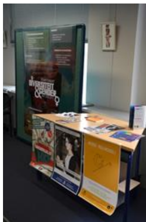
'Postermarkt' van de instellingen hoger onderwijs op de ronde tafel over het Aanmoedigingsfonds

Met een ronde tafel op 25 maart 2013 stoffeerde de Vlor de discussie over de toekomst van het Aanmoedigingsfonds en maakte een round-up van de realisaties.