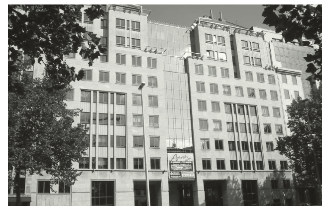
De kantoren van het Vlor-secretariaat in het Artemisgebouw in de Kunstlaan

Het intranet van de Vlor vormt de ruggengraat van de ledencommunicatie. De leden van de raden en commissies en de deelnemers aan tijdelijke werkgroepen kunnen zich snel en