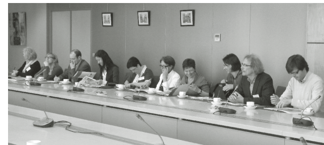
Vlaamse parlementsleden bezoeken de Vlor

Op 22 april ontving de Vlor de leden van de Commissie Onderwijs van het Vlaams Parlement. Zij kregen er een uitgebreide toelichting over de werking van de Vlor. De voorzitter van de Commissie verklaarde dat de commissieleden het advieswerk van de Vlor intensiever willen opvolgen, om zo een goed beeld te krijgen van wat in het onderwijsveld leeft. De Commissie Onderwijs en de Vlor spraken af om jaarlijks samen te komen om zicht te krijgen op elkaars agenda en planning.