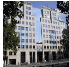
De Vlor huist in het Artemisgebouw op de Kunstlaan in Sint-Joost-ten-Node

In het werkjaar 2015-2016 telde de Vlor 24 medewerkers: 6 mannen, 18 vrouwen. Er werkten 17 statutairen, 5 contractuelen, 1 gedetacheerde en 1 leerwerker.