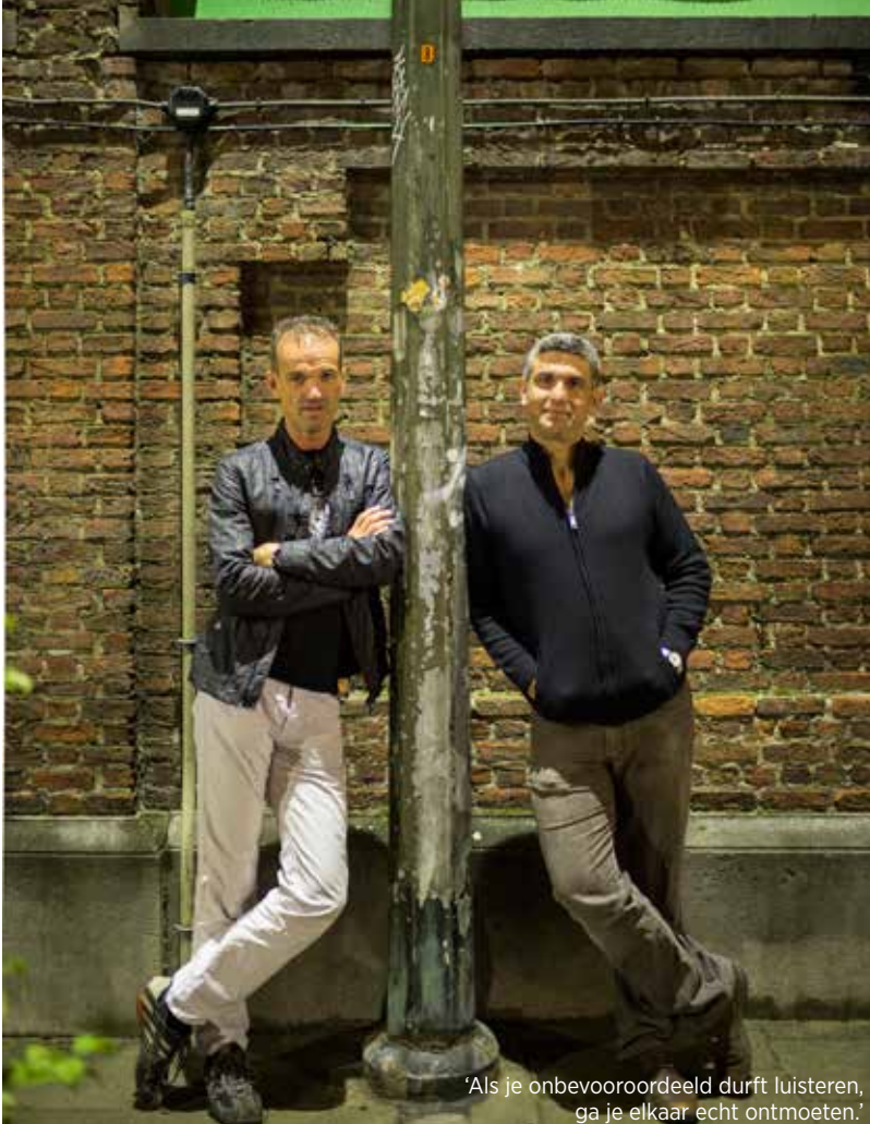
'Als je onbevooroordeeld durft luisteren, ga je elkaar echt ontmoeten.'