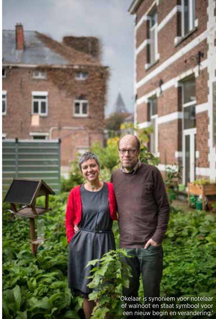
'Okelaar is synoniem voor notelaar of walnoot en staat symbool voor een nieuw begin en verandering.'

TEKST Gerard Hautekeur • FOTO Filip Claessens