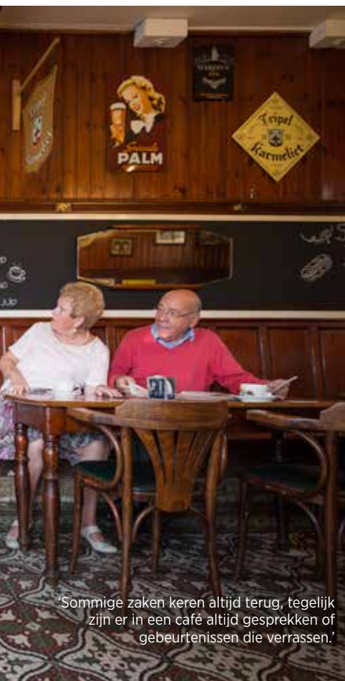
'Sommige zaken keren altijd terug, tegelijk zijn er in een café altijd gesprekken of gebeurtenissen die verrassen.'

i Op 't Hoeksken, Zijpstraat 2 in Wemmel, 02 460 03 52, open van 7:30 tot na het laatste rondje. Gesloten op woensdag.