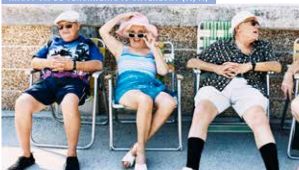
ANGST OM DE VERGRIJZING IS ONTERRECHT (18/11)

De agenda wordt samengesteld met gegevens uit de UITdatabank. Organisaties en verenigingen die hun activiteiten opgenomen willen zien in de agenda, moeten ons hun informatie anderhalve maand voor het verschijnen ervan bezorgen. Je kunt de gegevens mailen naar randkrant@derand.be , per brief sturen naar ons redactieadres (RandKrant – UIT in de Rand Agenda, Kaasmarkt 75, 1780 Wemmel) of invoeren in de UITdatabank via www.uitdatabank.be . Gezien het beperkte aantal beschikbare pagina's wordt bij de aankondigingen prioriteit verleend aan de activiteiten in de gemeenschaps- en cultuurcentra in de Rand. Om voor plaatsing in aanmerking te komen, worden de andere activiteiten vooral beoordeeld op hun uitstraling naar alle inwoners van de Rand. Het volledige vormingsaanbod van Arch'educ vind je op www.archeduc.be .