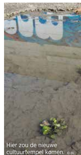
Hier zou de nieuwe cultuurtempel komen.

nigen. Oppositiepartij SP.A noemt de cultuurtempel 'het Uplace van de cultuurhuizen' en benadrukt dat er al 20 cultuurcentra zijn in een straal van 15 km rond het geplande project. Minister voor de Vlaamse Rand Ben Weyts (N-VA) wijst erop dat de voorstudie voor het nieuwe cultuurcentrum dateert van de vorige regering, waarvan de socialisten deel uitmaakten. Minister van Cultuur Sven Gatz (Open VLD) laat weten dat niets beslist is en een studie eerst nog moet uitmaken of het hele project haalbaar is. • TD