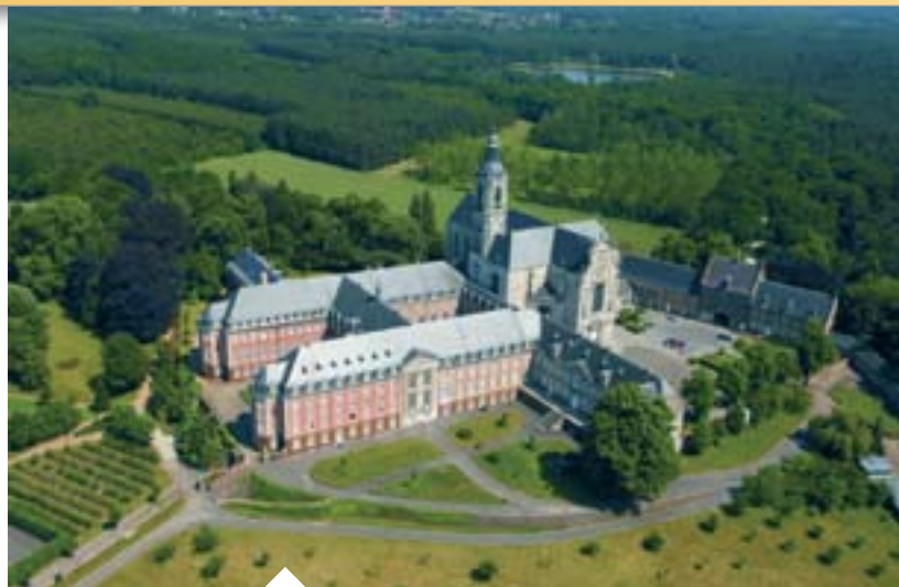
Het meest spraakmakende plattelandsproject in Vlaanderen speelt zich af rond de bossen van de Merode.