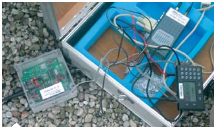
Als eerste fase werd voor de mesttransporten van de grotere mestvoeders (klasse C) de verplichting van een AGR-GPS-systeem opgelegd.

Als eerste fase werd voor de mesttransporten van de grotere mestvoeders (klasse C) de verplichting van