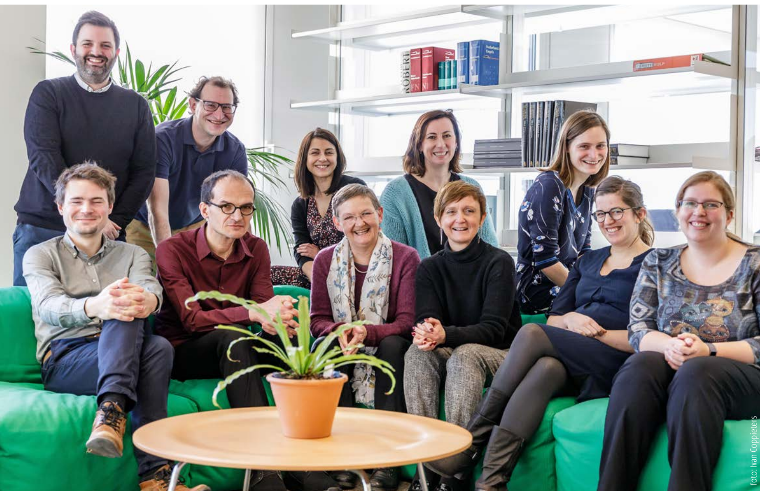
↑ Enkele medewerkers van het team Beleid