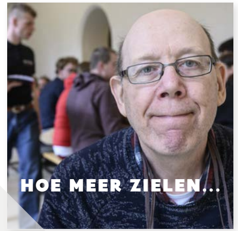
HOE MEER ZIELEN...