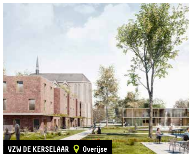
VZW DE KERSELAAR 📍 Overijse

Subsidie verkregen voor de nieuwbouw van wooninfrastructuur voor 12 volwassen personen met een matig tot ernstig verstandelijke handicap