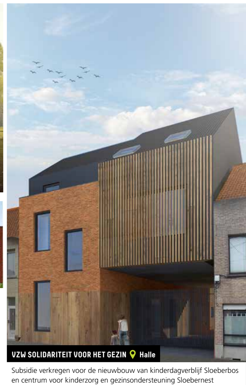
VZW SOLIDARITEIT VOOR HET GEZIN 📍 Halle

Subsidie verkregen voor de nieuwbouw van 35 studio's voor vaste bewoners met een beperking, 5 logeerkamers en 20 studio's binnen het concept van zorghotel