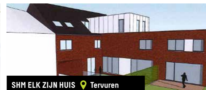
SHM ELK ZIJN HUIS 📍 Tervuren

Subsidie verkregen voor de nieuwbouw van een dag-activiteitencentrum en twee residentiële wooneenheden voor in totaal 36 volwassen personen met een beperking