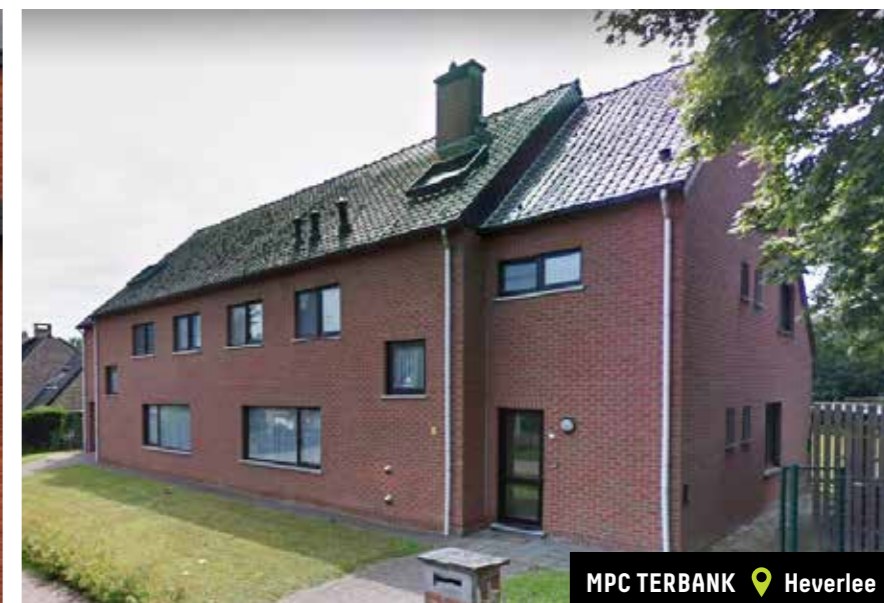
MPC TERBANK 📍 Heverlee

Subsidie verkregen voor de aankoop van een kinderdagverblijf