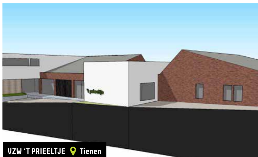
VZW 'T PRIELTJE 📍 Tienen

Subsidie verkregen voor de nieuwbouw van 6 studio's met gemeenschapsruimte + een dagcentrum met atelierruimte voor volwassenen met een beperking