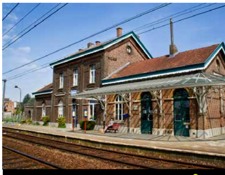
VZW WONEN EN WERKEN VOOR PERSONEN MET AUTISME 📍 Herne

Subsidie verkregen voor de aankoop van een pand ter uitbreiding van wijkgezondheidscentrum Caleido