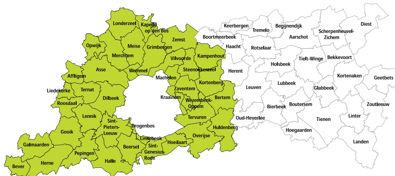
WERKGEBIED WONEN EN ZORG