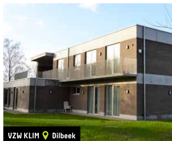
VZW KLIM 📍 Dilbeek

Subsidie verkregen voor de nieuwbouw van kinderdagverblijf Sloeberbos en centrum voor kindzorg en gezinsondersteuning Sloebernest