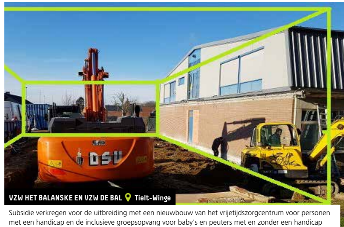
VZW HET BALANSKE EN VZW DE BAL 📍 Tielt-Winge

Subsidie verkregen voor de renovatie van het dak van home Langenberg voor volwassen personen met een handicap