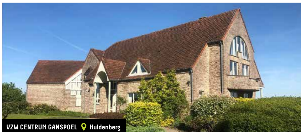
VZW CENTRUM GANSPOEL 📍 Huldenberg

Subsidie verkregen voor de aankoop van een woning voor personen met een handicap en de uitbreiding ervan met 1 leefgroep