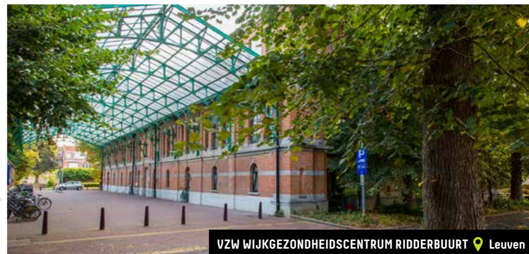
VZW WIJKGEZONDHEIDSCENTRUM RIDDERBUURT 📍 Leuven

Subsidie verkregen voor de nieuwbouw van kinderdagverblijf DoRemy