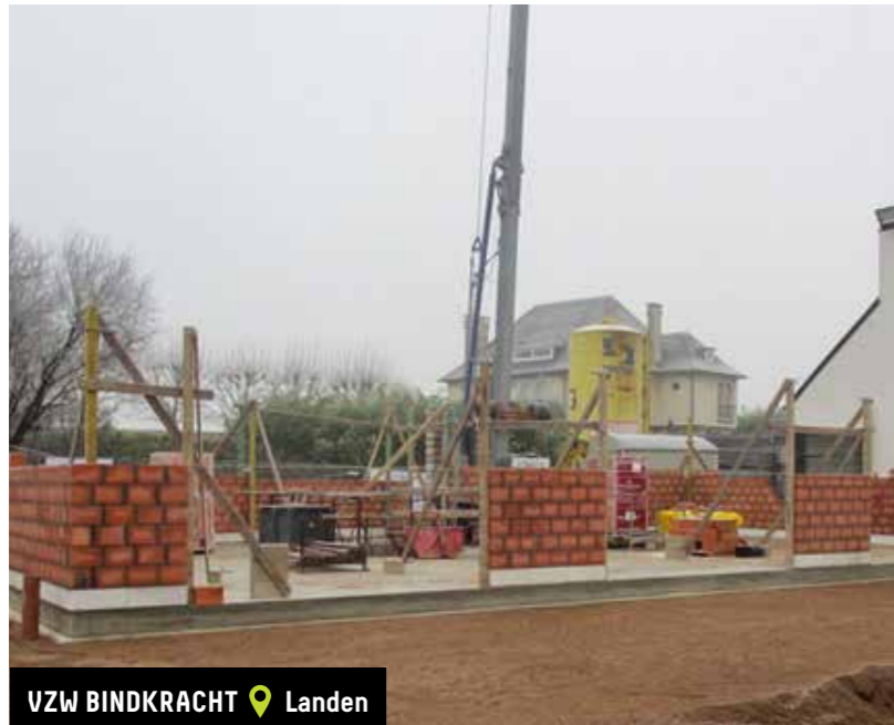
VZW BINDKRACHT 📍 Landen

Hieronder vindt u de 25 subsidiedossiers die een subsidietoekenning hebben ontvangen.