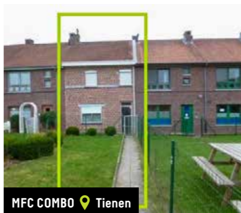
MFC COMBO 📍 Tienen

Subsidie verkregen voor het aanbrengen van een personenlift in een tweewoonst voor volwassen personen met een handicap