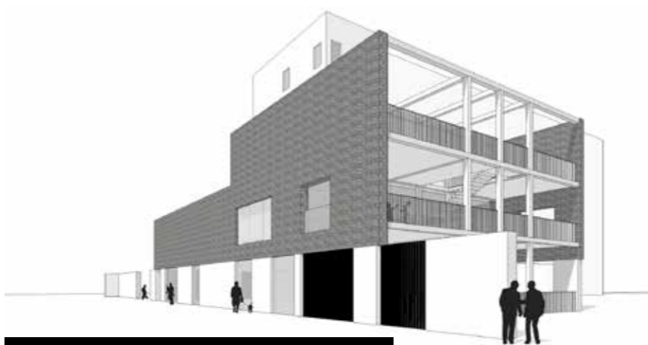
ZORG LEUVEN 📍 Leuven

Subsidie verkregen voor de verbouwing van de kantoren van de ambulante begeleidingsdienst in de bijzondere jeugdzorg