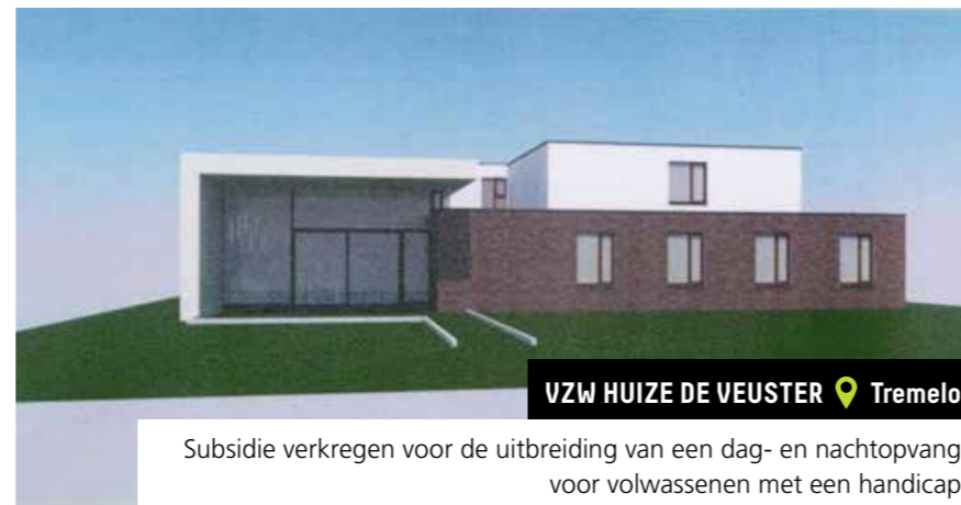
VZW HUIZE DE VEUSTER 📍 Tremelo

Subsidie verkregen voor een nieuwbouw van een dag- en nachtopvang voor kinderen en jongvolwassenen met een handicap