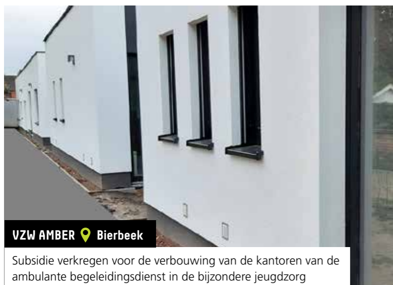
VZW AMBER 📍 Bierbeek

Subsidie verkregen voor de plaatsing van zonnepanelen op het dak van residentie Schoonberg voor volwassen personen met een handicap