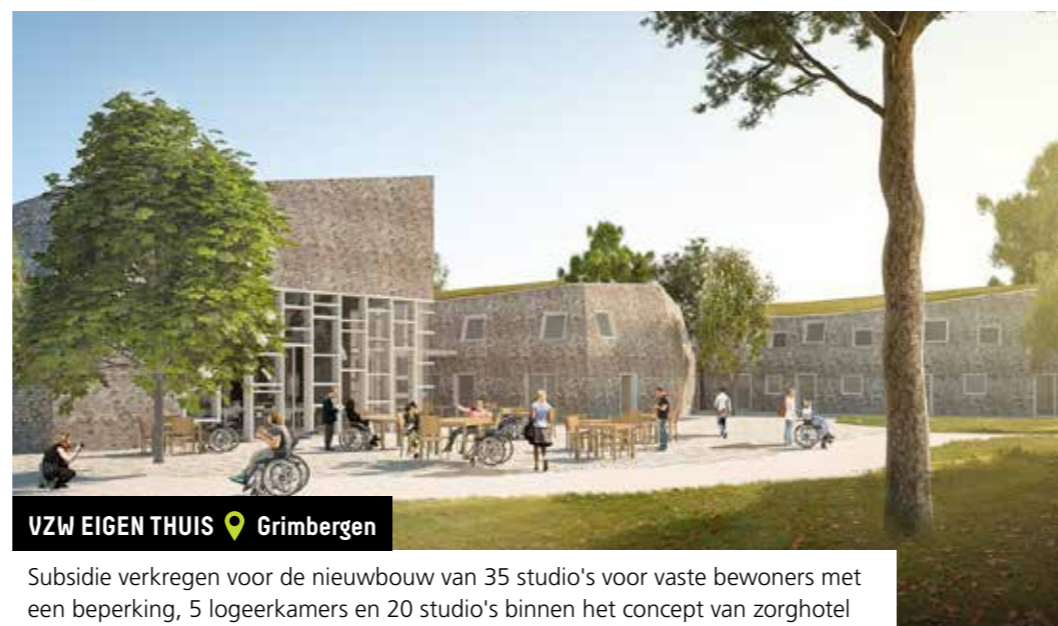
VZW EIGEN THUIS 📍 Grimbergen

Subsidie verkregen voor de nieuwbouw van het multifunctioneel centrum voor kinderen met een ernstig tot matige mentale beperking en/of motorische beperking met al dan niet andere beperkingen