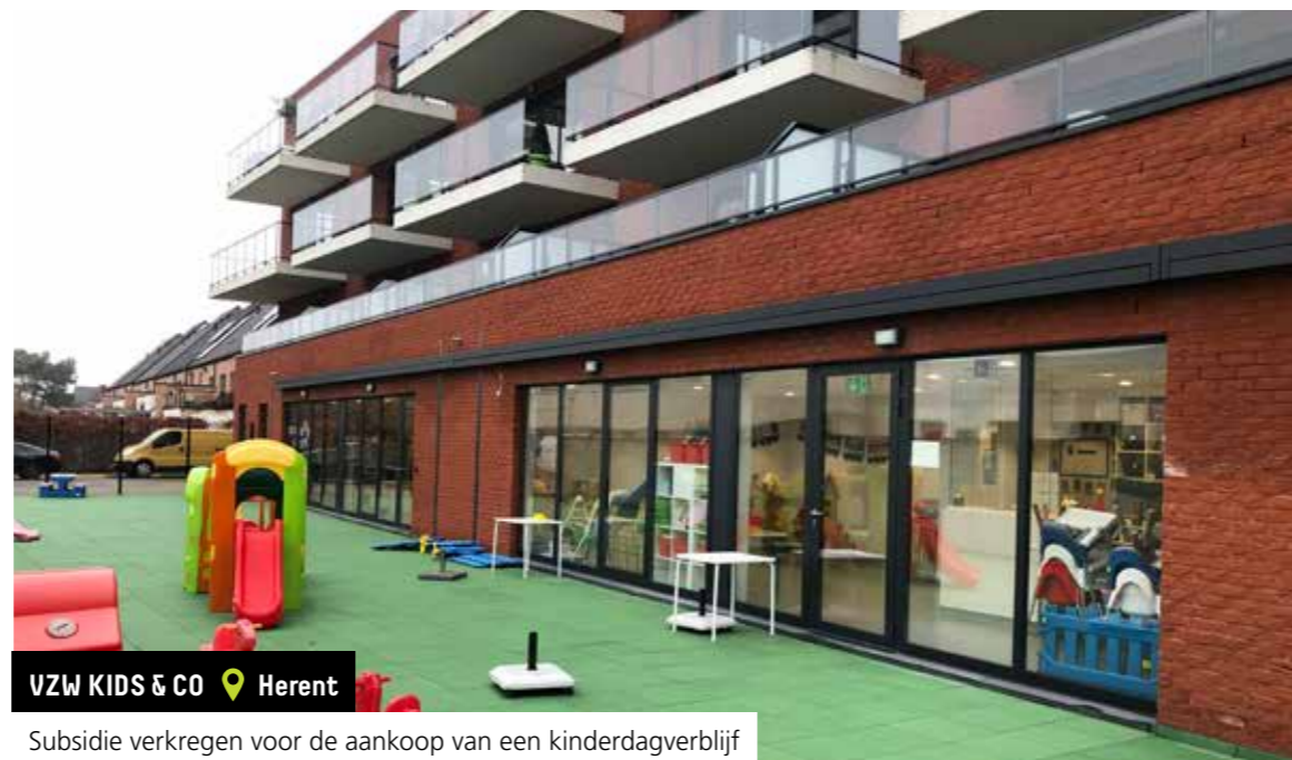
VZW KIDS & CO 📍 Herent

Subsidie verkregen voor de renovatie van het oude stationsgebouw tot een eetcafé en buurtwinkel voor inclusieve dagbesteding