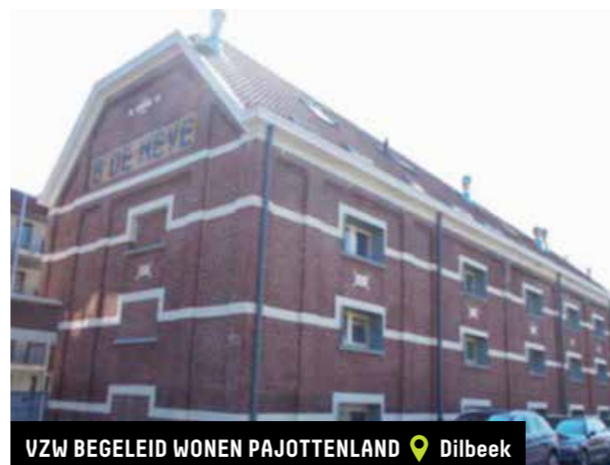
VZW BEGELEID WONEN PAJOTTENLAND 📍 Dilbeek

Subsidie verkregen voor de aankoop van een woning voor personen met een handicap en de uitbreiding ervan met 1 leefgroep