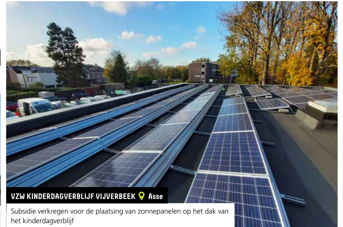
VZW KINDERDAGVERBLIJF VIJVERBEEK 📍 Asse

Subsidie verkregen voor de uitbreiding van een dag- en nachtopvang voor volwassenen met een handicap