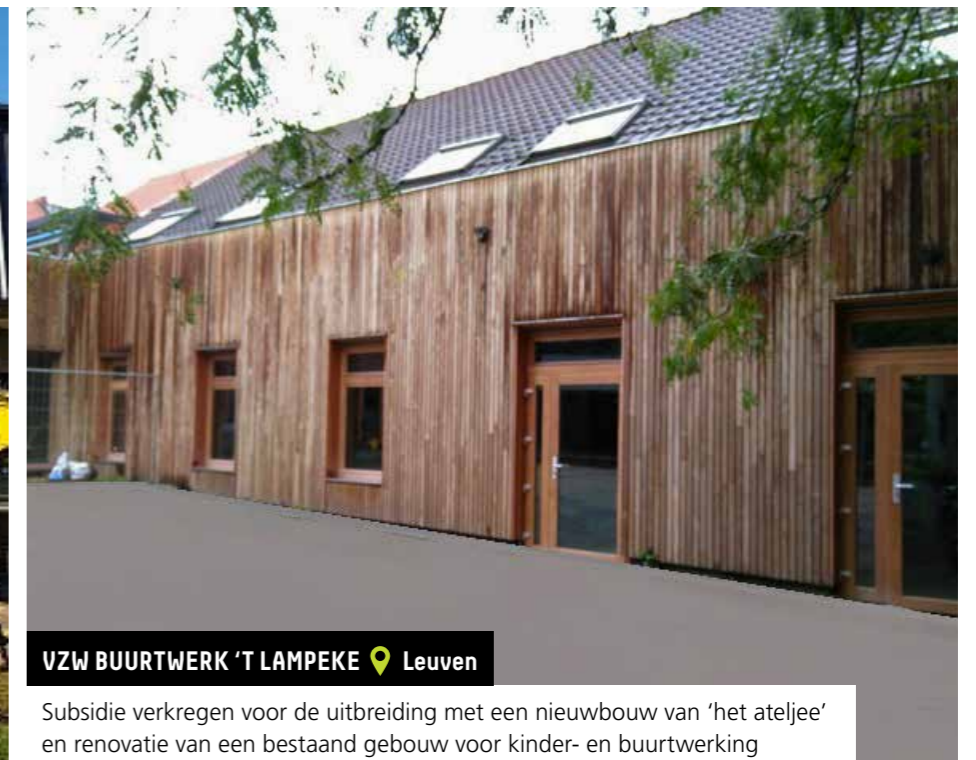
VZW BUURTWERK 'T LAMPEKE 📍 Leuven

Subsidie verkregen voor de uitbreiding met een nieuwbouw van het vrijetijdscentrum voor personen met een handicap en de inclusieve groepsopvang voor baby's en peuters met en zonder een handicap