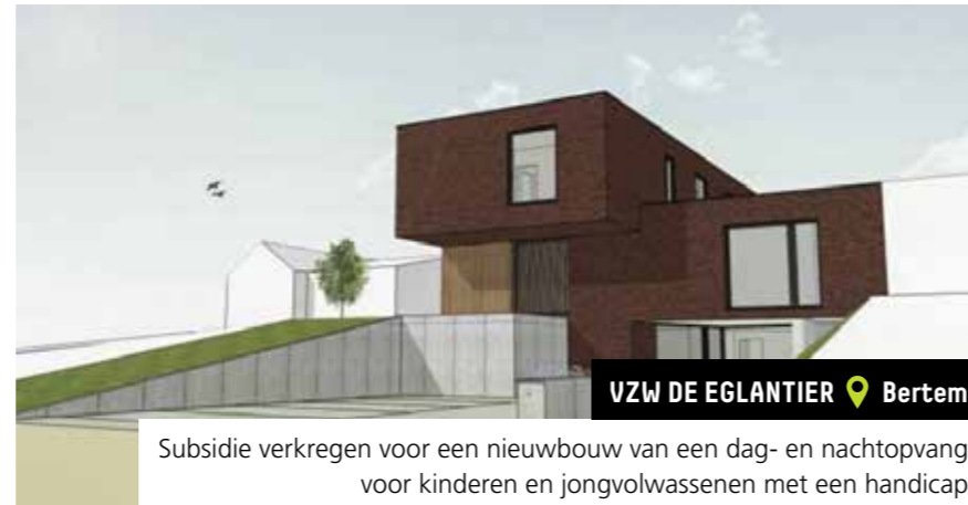
VZW DE EGLANTIER 📍 Bertem

Subsidie verkregen voor de aankoop van de Bindkrachtvilla voor dag- en nachtopvang van jonge personen met een handicap en de uitbreiding ervan met een nieuwbouw