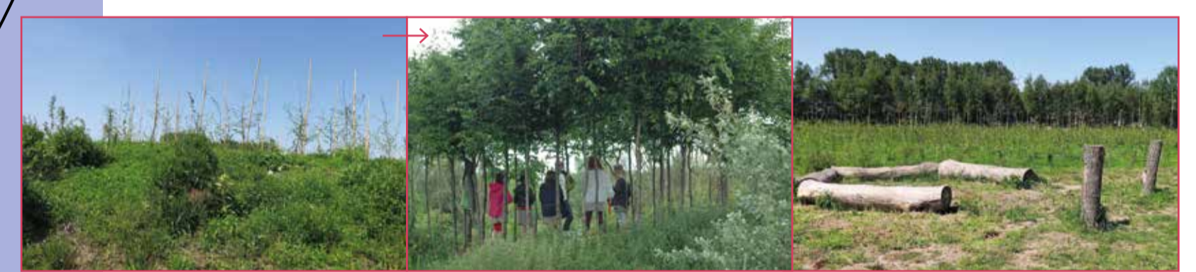
Hier groeit een bomenheuvel.