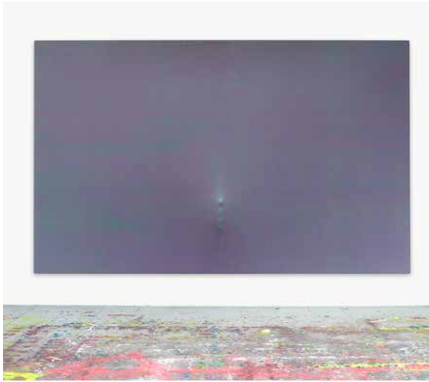
Michel Mouffe, Thinking the veil

De tentoonstelling Abstracte kunst in vogelvlucht in het museum FeliXart in Drogenbos doet wat ze belooft. Ze geeft de bezoeker een snelle maar grondige blik op wat abstracte kunst was in het verleden en wat ze vandaag nog kan betekenen.