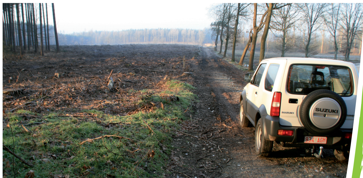
Controle van de werken

Vul je contactgegevens in op deze bon en deponeer hem aan de Merodestand. De eerste 100 personen krijgen een spelkwartel. Bovendien maak je kans op één van de twintig wandelkaarten van het wandelnetwerk de Merode!'