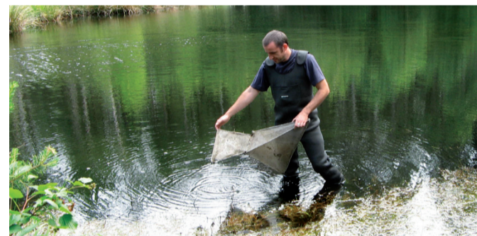
Ecologische en hydrologische studies