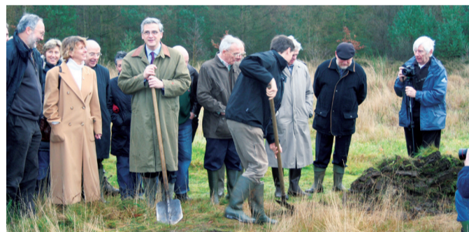
Officiële start van het project met eerste spadesteek door dhr. Kris Peeters, toenmalig minister van leefmilieu

de Merode en doorverkocht aan Natuurpunt is er gekozen om het gebied open te stellen en meer ecologische variatie te brengen in de monotone naaldbossen. Met de inzet van natuurinrichting en met behulp van Europese subsidies via LIFE Nature konden de laatste jaren concrete maatregelen worden genomen op het terrein.