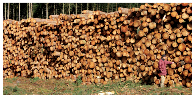
Grootschalige kapwerken om open plekken te maken in het bos