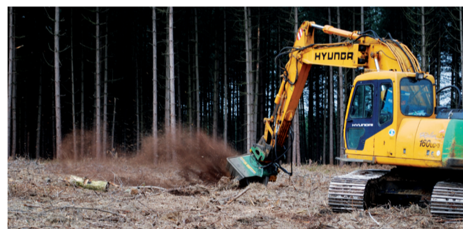
Ontstronken en plaggen van de bodem zodat de heide weer kan kiemen