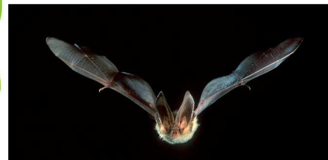
Bruine grootoorvleermuis in vlucht

soorten worden de volgende jaren nauwlettend in de gaten gehouden: nachtzwaluw, pilzegge, kleine plevier, koraaljuffer, drijvende waterweegbree, vinpootsalamander, boompieper, boomleeuwerik, dertienstippelig lieveheersbeestje, bloedrode heidelibel, bont dikkopje, kleine ijsvogelvlinder, varenuil, heidewortelboorder, grootoorvleermuis en laatvlieger