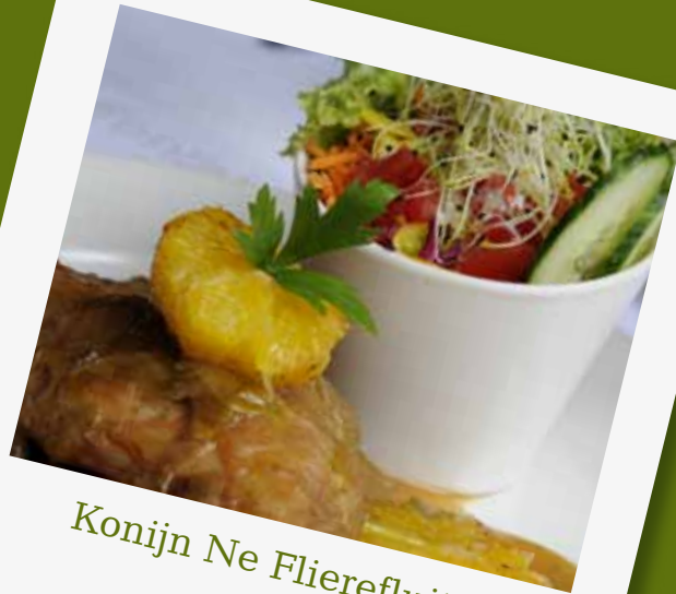
Konijn Ne Flierefluiters