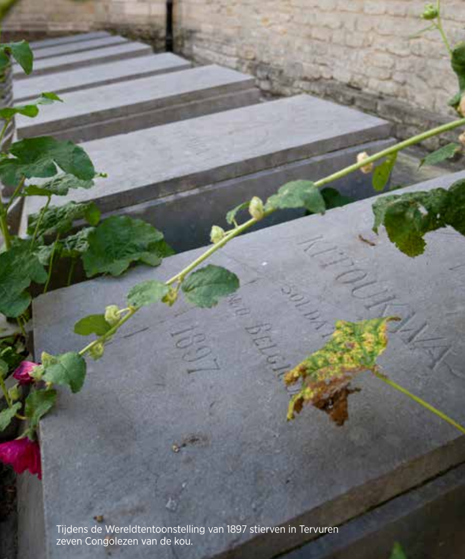
Tijdens de Wereldtentoonstelling van 1897 stierven in Tervuren zeven Congolezen van de kou.