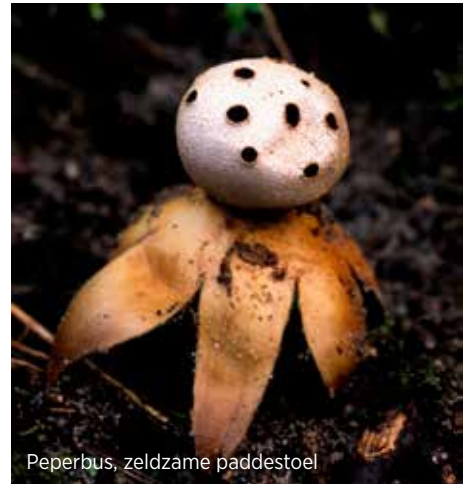
Peperbus, zeldzame paddestoel