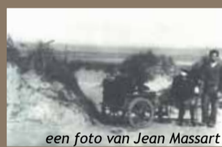
een foto van Jean Massart

Bij de herinrichting van de Noordduinen is gezorgd voor drie wandelpaden die aangeduid zijn met paaltjes. Het Coppilliepad (gele paaltjes) start aan de Strandlaan, kruist de Leopold III-laan en loopt langs de luchtmachtbasis. Doordat er ook een pad voorzien is ten zuiden van de Robert Vandammestraat, is het mogelijk een lus te maken die ook het Brits Militair Kerkhof aandoet. Dit pad loopt niet door de graaszones en is daarom geschikt voor wandelaars met honden.