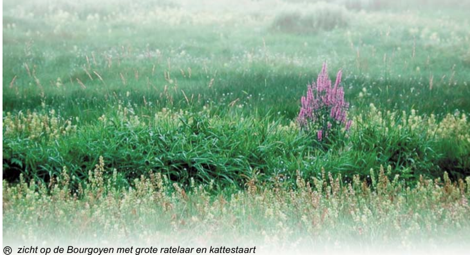
© zicht op de Bourgoyen met grote ratelaar en kattestaart

In deze krant wordt onder meer toegelicht hoe de voorziene inrichtingsmaatregelen in het natuurinrichtingsproject Bourgoyen-Ossemeersen gerealiseerd zullen worden.