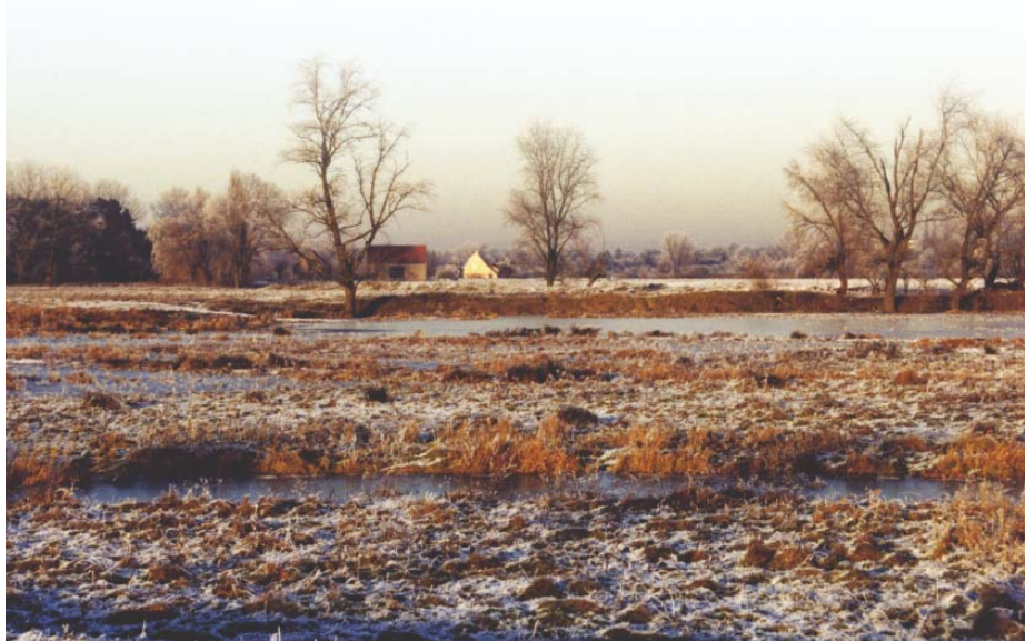
Valkenhuishoeve en omgeving

Het projectgebied heeft de bestemming natuurreservaat. Dit betekent dat de natuur hier op de eerste plaats komt. Omwille van de wetenschappelijke en landschappelijke waarde is een groot deel van het gebied eveneens beschermd als landschap.