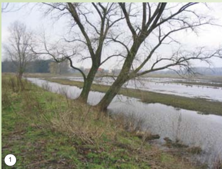
1. Zicht op de Loopgracht 2. Officiële start van de werken op 19 februari 2004 3. en 4. Ruimen van de Loopgracht

Daarom werd over een lengte van 1,8 km alle slib uit de Loopgracht verwijderd en afgevoerd.