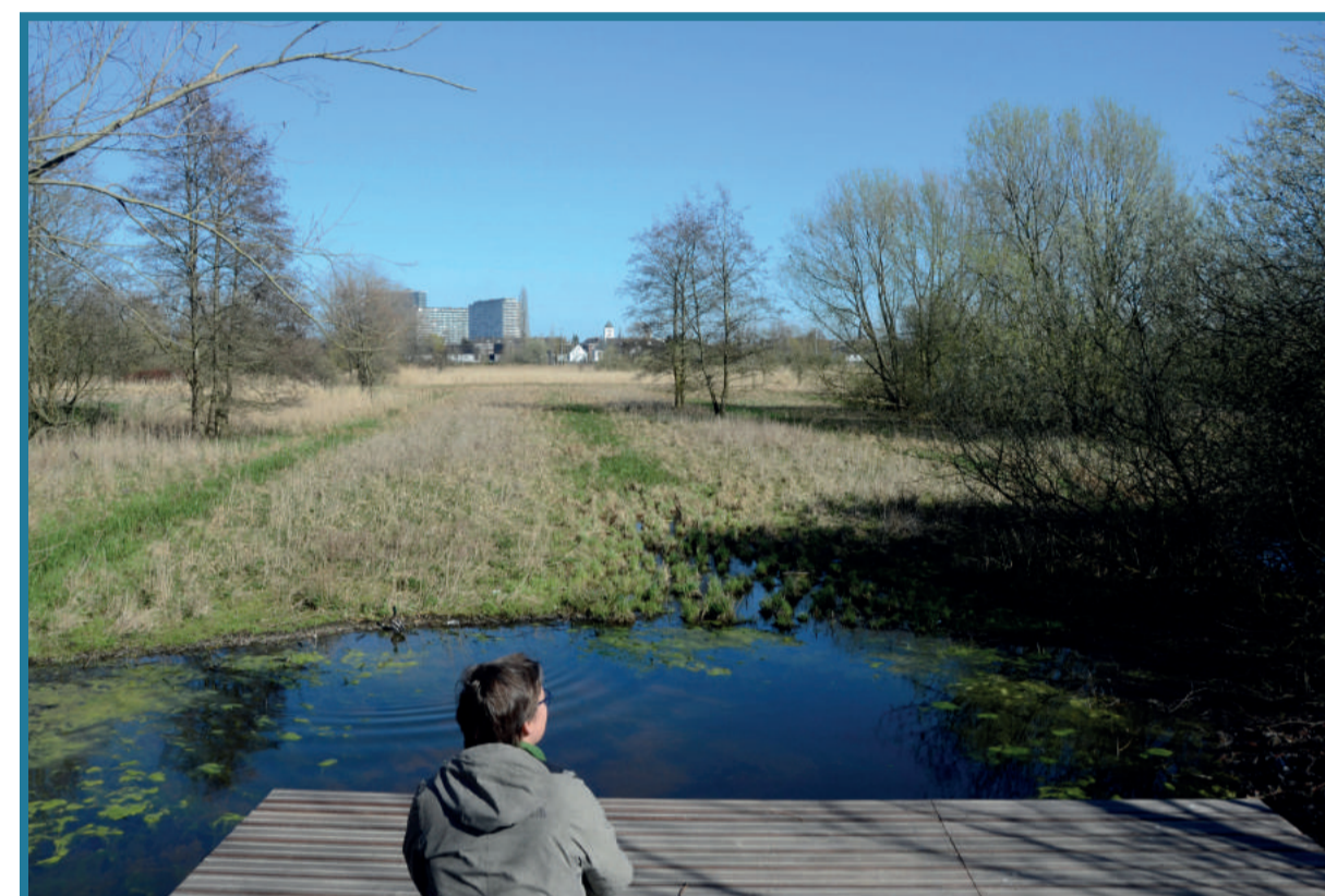
Van op het observatiepunt heb je een goed zicht op de meersen.

Doordat het grondwater hier opborrelt, is het gebied zeer nat. Het opborrelend grondwater noemen we 'kwel'. Om de weilanden te ontwateren, werden vroeger op regelmatige afstand ondiepe afwateringsgrachtjes gegraven. De uitgegraven grond werd gebruikt om de naastliggende percelen op te heffen, die daardoor bolronde en hoger kwamen te liggen.