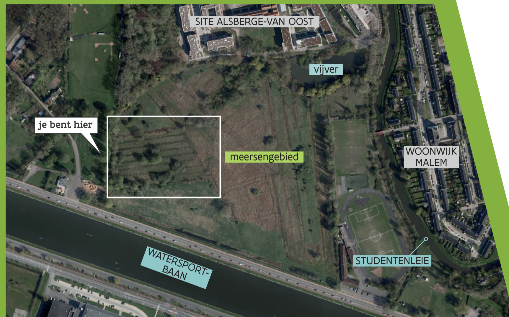
Landschappelijke structuur met laantjes (luchtfoto 2015)

De landschappelijke structuur met 'laantjes en meersen' is nagenoeg exact bewaard gebleven. Dit komt omdat een groot deel van de Malemmeersen, in tegenstelling tot hun directe omgeving, nooit drastisch zijn opgehoogd.