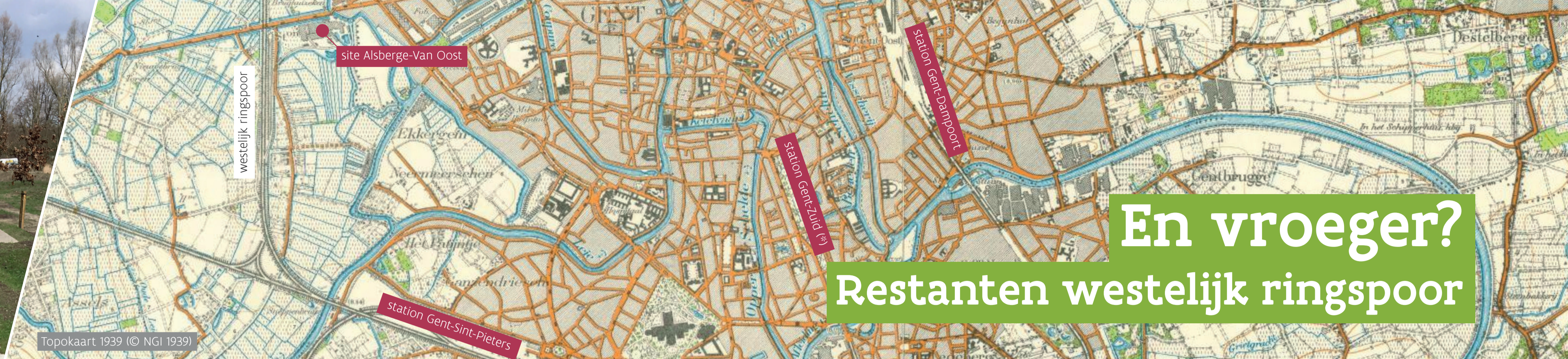
Topokaart 1939 (© NGI 1939)

Uitgeefster van 'De stem der vrouw', gemeenteraadslid en eerste vrouwelijke socialistische schepen in Ledebeg. Ze was ook lid van het Nationale Vrouwenactiecomité.