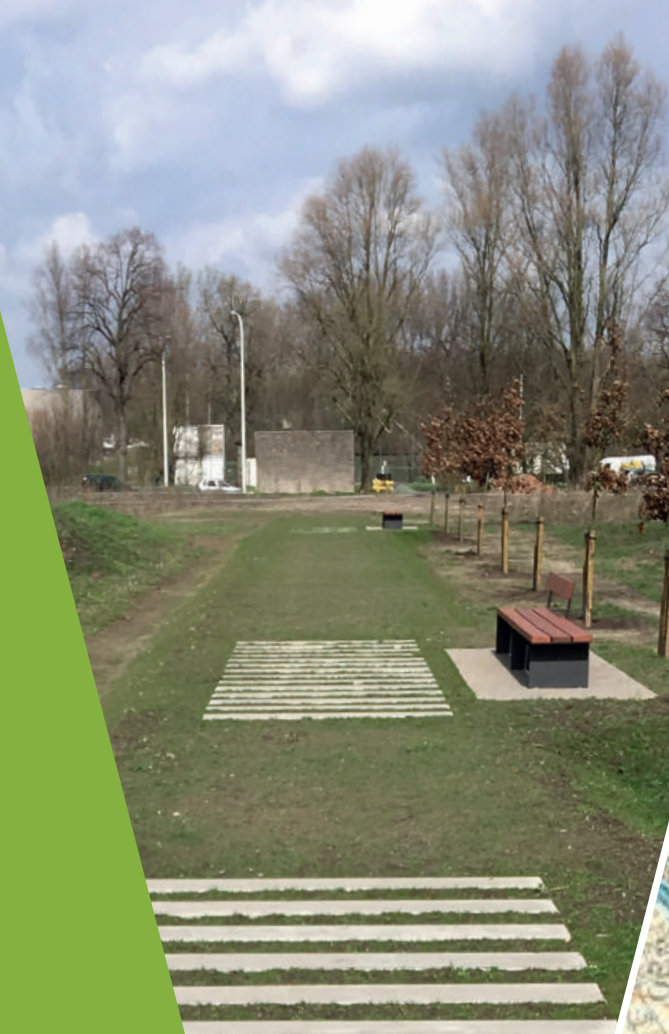
Betonplaten accentueren vandaag de vroegere spoorlijn