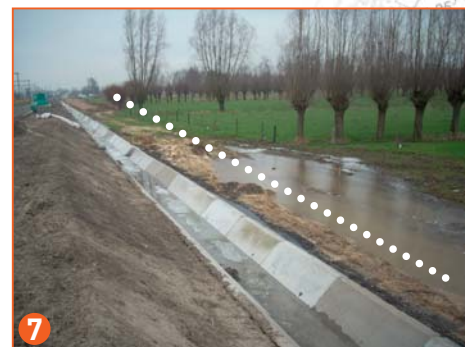
locatie fietspad - uitvoering door Infrabel (NMBS)