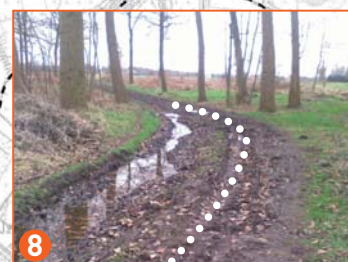
te verbeteren fietsverbinding

De foto's zijn locaties waar werkzaamheden zullen worden uitgevoerd