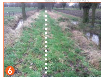
locatie nieuwe fietsverbinding