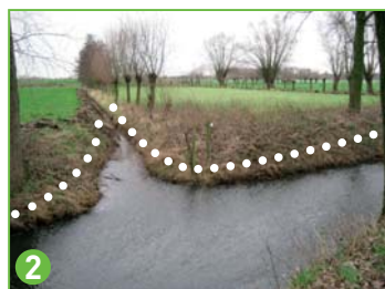
locatie bufferstrook - oeverzone uitvoering door VMM