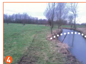
locatie nieuw brugje