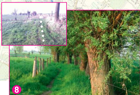
8 Wandelpad - situatie voor en na