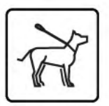
honden aan de lijn

Samen met de ingerichte oeverstroken langs het Molenvaardeken vormen de vijvers een uitstekend leefgebied voor (diverse) planten en dieren.