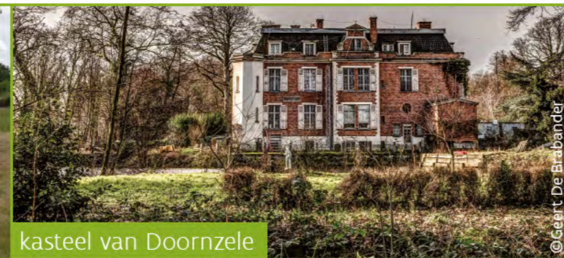
kasteel van Doornzele