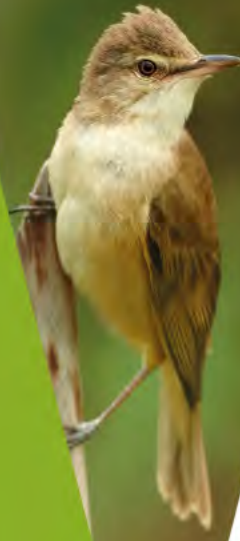
← grote karekiet