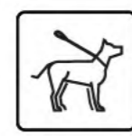
honden aan de lijn

De zuidelijke oever werd niet vergraven. De aangeplante hoogstambomen op de oever vormen een visuele buffer voor de omwonenden.