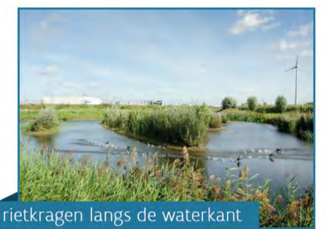
rietkragen langs de waterkant

De zuidelijke oever werd niet vergraven om de onderhoudswerken aan het Molenvaardeken te blijven garanderen. Het waterpeil wijzigt niet, zodat de landbouwgronden ten zuiden van het Molenvaardeken even goed blijven afwateren als voorheen.