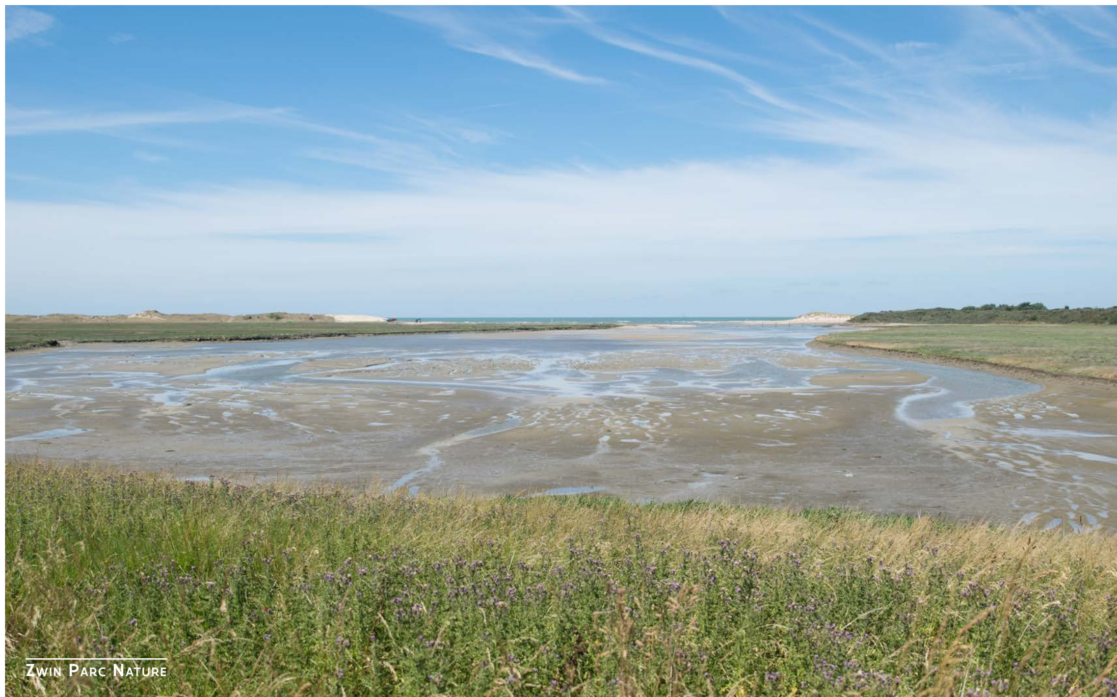
ZWIN PARC NATURE