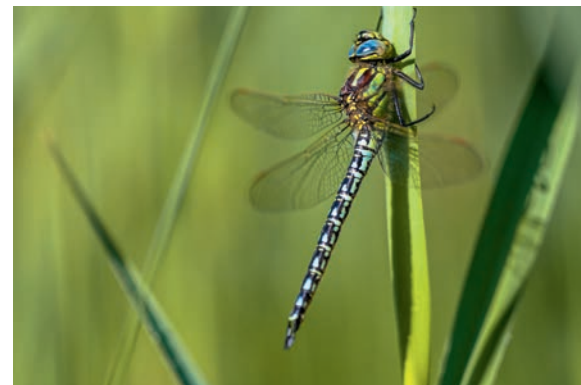
Des cours d'eau et des paysages vivants