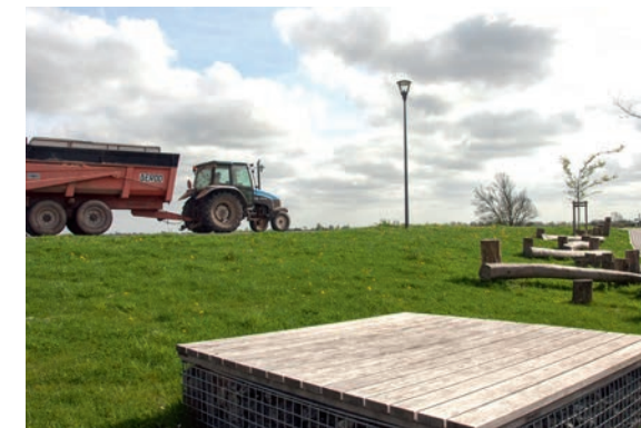
Achat, vente et échange de terres