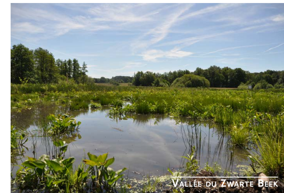
VALLÉE DU ZWARTE BEEK