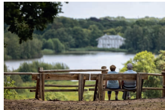
Aménagement des espaces ouverts