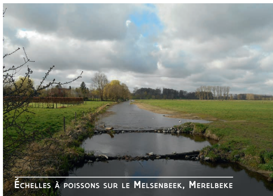
ÉCHELLES À POISSONS SUR LE MELSENBEEK, MERELBEKE