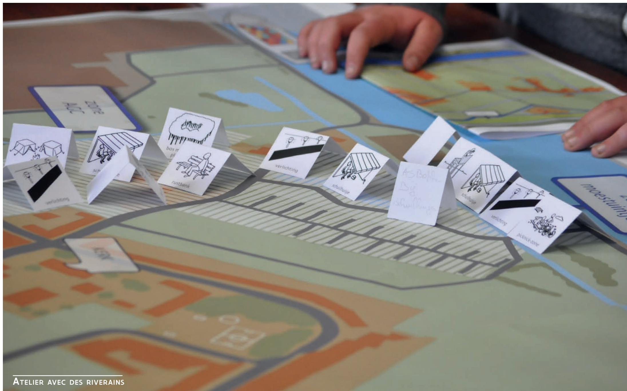
ATELIER AVEC DES RIVERAINS

Dans le village de polders de Nieuwmunster, dans la commune de Zuienkerke, on trouve une zone de 1,5 hectare affectée comme zone résidentielle et protégée en tant que site rural. Cette zone comprend une ferme inoccupée, désignée comme patrimoine architectural. Sur le plan spatial, il n'est pas souhaitable de développer la ferme et les terres environnantes en zone d'habitat. Par la voie 2 du décret relatif à la rénovation rurale, la commune peut avoir recours à l'instrument du « relotissement imposé par force de loi avec échange planologique » afin que la zone d'habitat dans son ensemble puisse être déplacée en tant qu'affectation vers un endroit plus approprié du village. Dans le même temps, la propriété et l'utilisation des terres d'environ 25 propriétaires/utilisateurs seront échangées et un nouveau domaine public sera créé pour aménager une piste cyclable et pédestre sûre. La ferme protégée sera aménagée en lieu de rencontre pour tous les habitants du village.