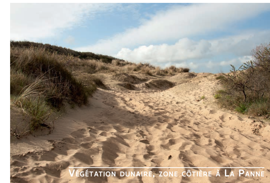
VÉGÉTATION DUNAIRE, ZONE CÔTIÈRE À LA PANNE