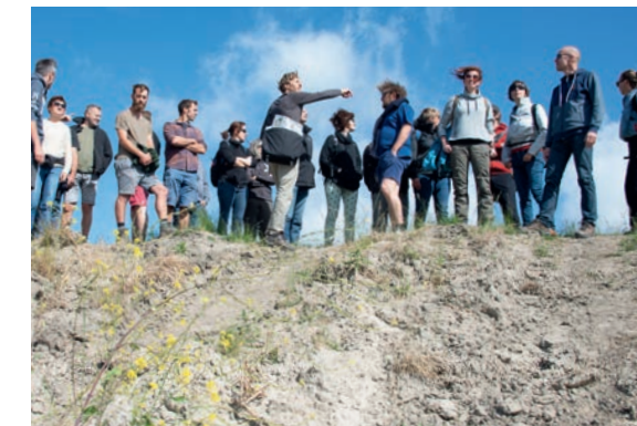
Quels sont nos atouts?