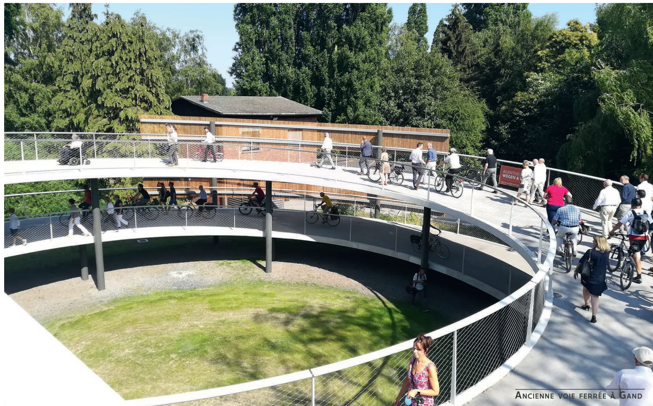
ANCIENNE VOIE FERRÉE À GAND