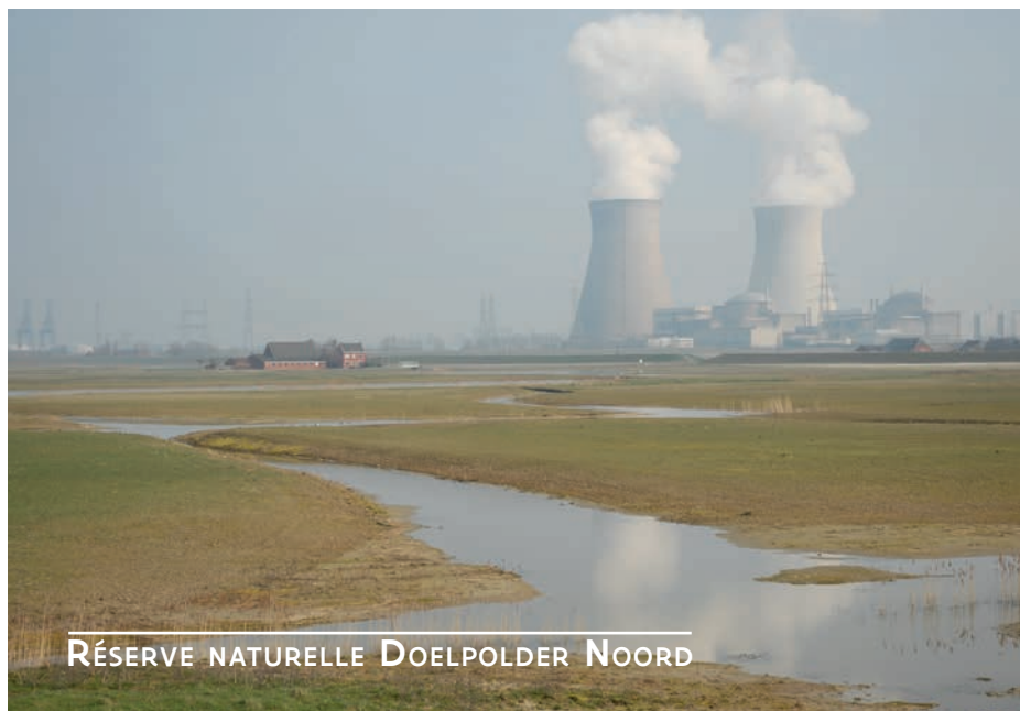
RÉSERVE NATURELLE DOELPOLDER NOORD

Au sein de la banque foncière locale de la rive droite de l'Escaut, les terrains nécessaires ont été libérés pour l'extension du port d'Anvers sur la rive droite de l'Escaut. La banque foncière a pu acquérir 45 hectares de terres en échange sur une période de 6 ans. La Vlaamse Landmaatschappij a ainsi pu offrir une solution concrète aux exploitations agricoles concernées qui souhaitent poursuivre leurs activités. Sur la rive gauche de l'Escaut, 675 hectares de terres agricoles ont été acquis pour la réalisation du Plan de Développement de la Nature et la logistique Park West, pour un montant de 38 millions d'euros, financés par la Région flamande, la Maatschappij Linkerscheldeover et la Gemeentelijk Havenbedrijf Antwerpen. Les agriculteurs touchés ont bénéficié de mesures d'accompagnement, dont 125 hectares de terres en échange. On a ainsi évité des expropriations judiciaires.