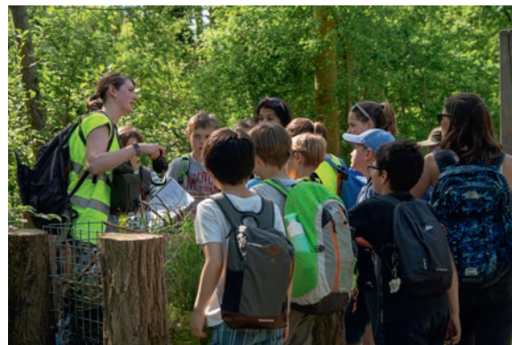
Agir pour le climat