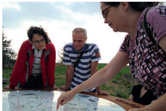
Une politique des espaces ouverts et rurale dynamique