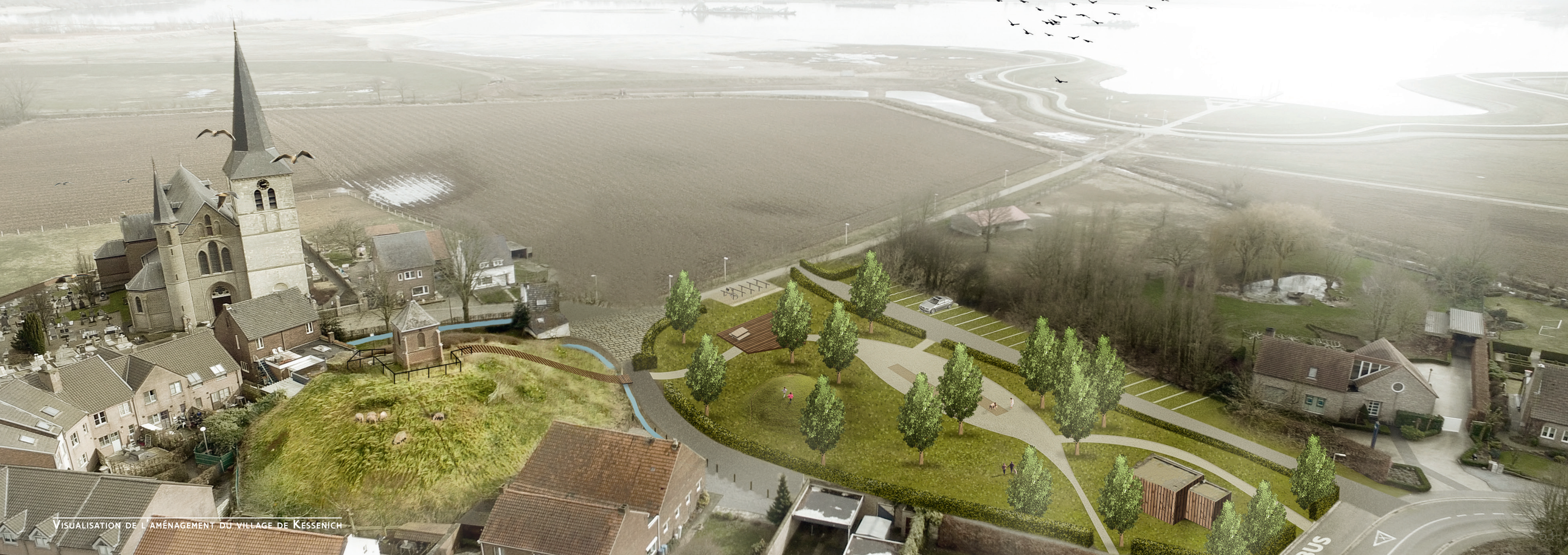
VISUALISATION DE L'AMÉNAGEMENT DU VILLAGE DE KESSENIICH