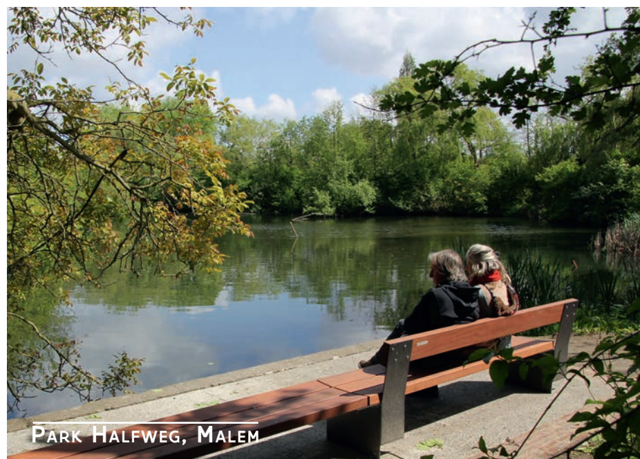
PARK HALFWEG, MALEM