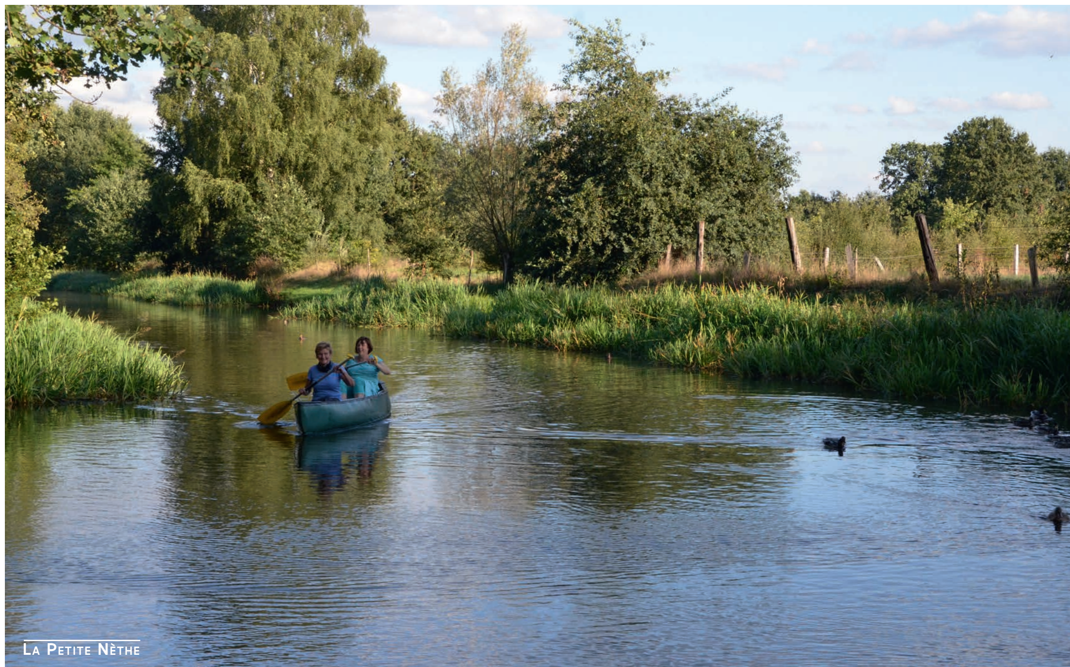
LA PETITE NÈTHE

La région côtière est l'une des zones où les effets du changement climatique se feront le plus sentir. Le Zwin a été agrandi. Afin de prévenir la salinisation dans la région des polders environnants, il était nécessaire de coordonner l'aménagement des digues et des cours d'eau. La Vlaamse Landmaatschappij continue de se concentrer sur l'acquisition nécessaire de terres et fournit des subventions pour les mesures relatives au paysage. Nous nous concentrons également sur l'échange de connaissances dans le cadre de projets européens tels que SALFAR, FRESH4C's, CARBON CONNECTS, COASTAL et VEDETTE.