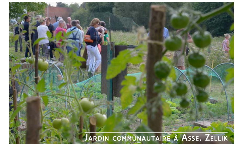
JARDIN COMMUNAUTAIRE À ASSE, ZELLIK

Depuis 2008, diverses initiatives ascendantes ont été stimulées et soutenues pour les objectifs de cohésion sociale, de participation et d'habitabilité dans les villages. L'Association flamande pour les Intérêts des villages, les Ateliers de village de Landelijke Gilden vzw et le projet Buurten op den Buiten, en collaboration avec la Fondation Roi Baudouin, en sont des exemples. En outre, depuis 2017, la Vlaamse Landmaatschappij organise le concours Dorpskracht. Une publication sur la politique villageoise offre aux administrations locales des moyens de se mettre au travail de manière concrète. Les idées et expériences issues des projets, complétées par les informations recueillies lors de 3 journées de dialogue en 2017, ont été intégrées dans un rapport consultatif sur la politique villageoise en Flandre. Elles pourront être développées lors de la prochaine législature et déboucher sur de nouvelles initiatives.