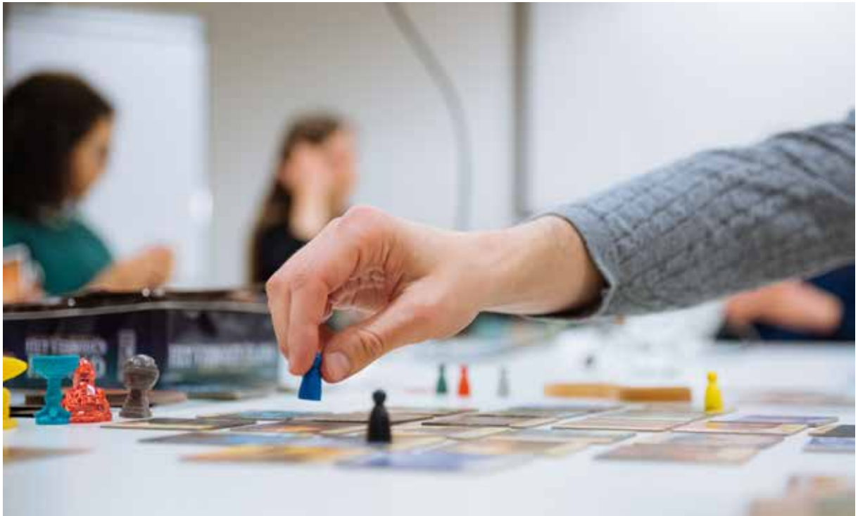
BABEL EN SPEEL

vrijblijvend bezoek, voor het gebruik van de collectie Nederlands Leren, of om deel te nemen aan een van de activiteiten die gericht zijn op Nederlands oefenen. Door een groot aanbod te voorzien, is Muntpunt een baken voor al wie Nederlands leert in Brussel.