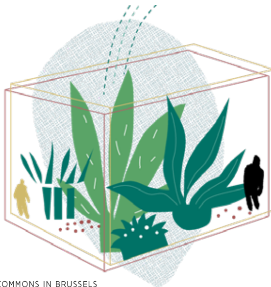
COMMONS IN BRUSSELS

Sinds 2019 is er naast de algemene gele balie aan de ingang, een tweede balie waar interne experts en partners bij allerlei thema's hulp bieden ( Hulp bij inschrijven, Infopunt Vrijwilligerswerk, de Appotheek en Muntpunt wordt Sportpunt ). Hier kan meer tijd worden vrijgemaakt om mensen diepgaander en nog persoonlijker te helpen. Deze wegwijsbalie kon sinds haar oprichting rekenen op een exponentiële groei aan