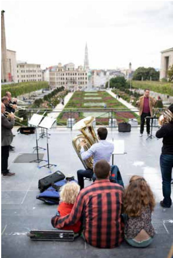
VLAANDEREN FEEST. BRUSSEL DANST

Tips voor de Thuisblijvers , nieuwsbrieven met tal van online Brusselse cultuuralternatieven.