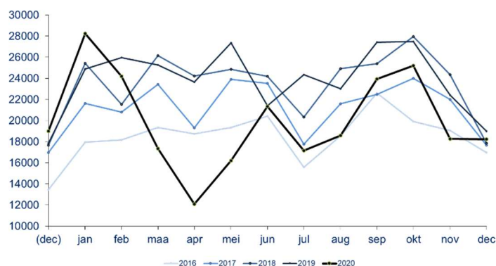
Aantal ontvangen vacatures per maand

Voor elke maand van de voorbije vijf jaren wordt het aantal in die maand ontvangen vacatures getoond. De maand-op-maand evolutie en de seizoenschommelingen zijn duidelijk. Ook is zichtbaar hoe een bepaalde maand scoort in vergelijking met dezelfde maand in andere jaren.