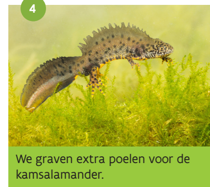
We graven extra poelen voor de kamsalamander.