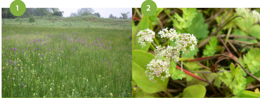
Op dit voormalig stort wordt de grond met baksteenresten verwijderd. Zo ontstaat ruimte voor natte natuur. De bloemrijke, vochtige duinpannes zullen heel wat vogels aantrekken.

De terreinen tussen de Schuddebeurzeweg, de Langestraat en de Heidestraat zijn eigendom van Natuurpunt en van Natuur en Bos van de Vlaamse overheid. Ze zijn al enige tijd in natuurbeheer en evolueren naar voedselarm, soortenrijk duingrasland. Deze evolutie gaat traag omdat er door vroegere bemesting nog veel voedingsstoffen in de bodem zitten. In één zone is in het verleden zand afgegraven en daarna werd grond met steenpuin gestort.