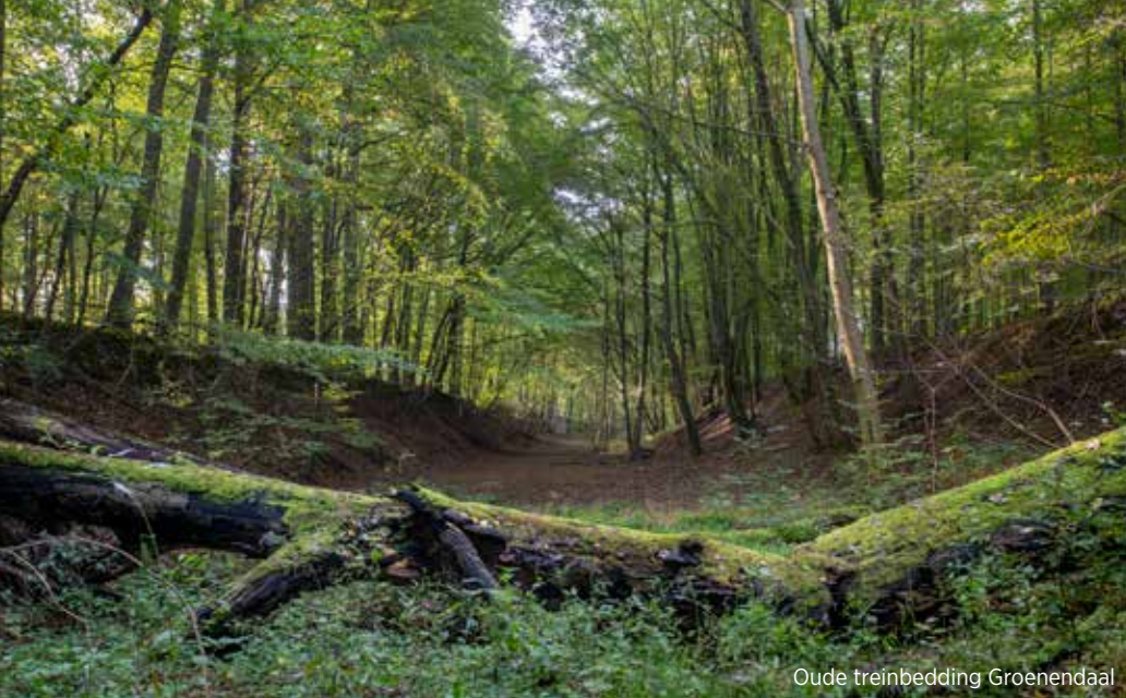
Oude treinbedding Groenendaal