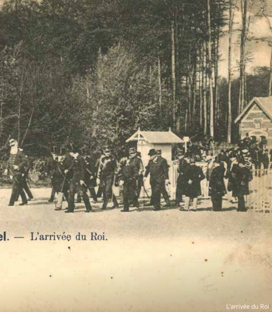
L'arrivée du Roi