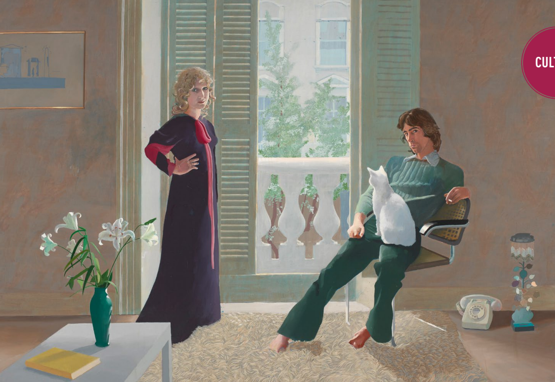
Mr and Mrs Clark and Percy, David Hockney (1970-71)