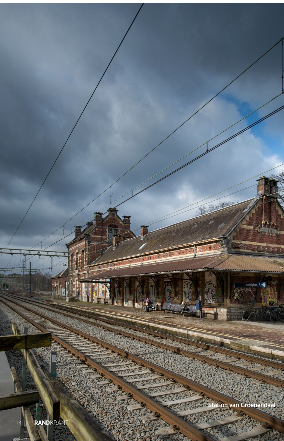
Station van Groenendaal

Groenendaal is een bijzondere plek. Leopold II kneedde de plaats aan de rand van het Zoniënwoud tot zijn geliefde speeltuin, maar het was vaak dankzij vrouwen dat de plek haar poëtische kant vrijgaf. TEKST Koen Demarsin