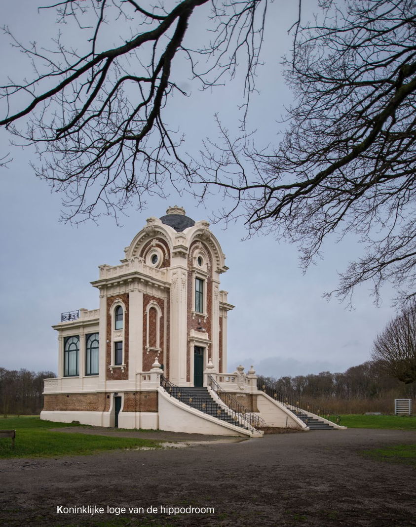
Koninklijke loge van de hippodroom