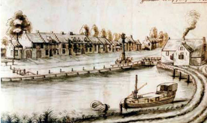
De sluis van Drie Fonteinen (1725)

In 1956 kocht de stad het volledige domein Drie Fonteinen aan en werd het mondjesmaat tot een prachtig park gerenoveerd. De talrijke mensen die in het park wandelen, van de natuur genieten en van een glas in de vroegere orangerie van het kasteel zijn niet altijd bewust van de voorgeschiedenis van dit prachtige domein.