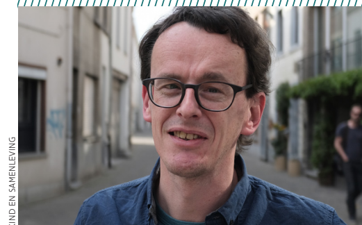
KIND EN SAMENLEVING

“Het is altijd een goed idee om de rol van gemotoriseerd verkeer in vraag te stellen en je af te vragen of er meer ruimte voor voetgangers en fietsers kan vrijgemaakt worden. Systematisch de schoolroutes, fietsroutes of andere routes die de jeugd vaak gebruikt onderzoeken, de knelpunten in kaart brengen en oplossen is ook een goede manier om dit probleem aan te pakken. Maar naast