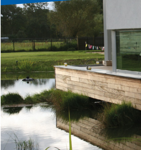
Woning op kolommen

Bij overtredingen kan de waterloopbeheerder een proces-verbaal opmaken wat kan leiden tot afbraak van de constructie, boetes en vervolging.