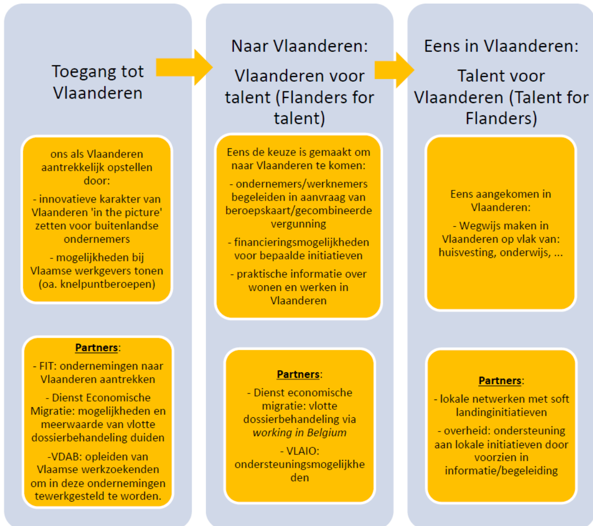
FIGUUR 1: Schematisch plan om buitenlands talent aan te trekken naar Vlaanderen én in Vlaanderen te houden