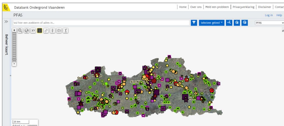
Figuur 2: Illustratie PFAS-verkenner