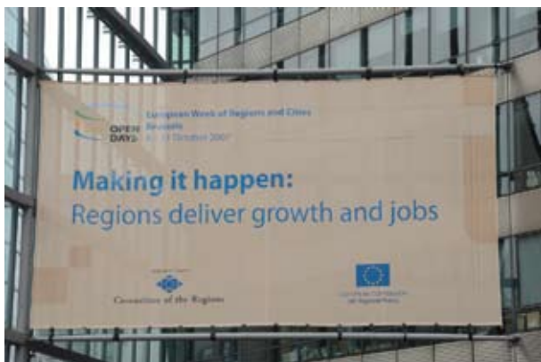
Toekomst van het cohesiebeleid