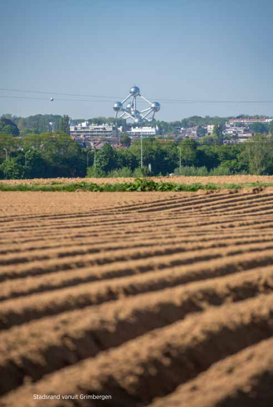
Stadsrand vanuit Grimbergen

► ook in de eeuwen die volgden, konden voorbijgangers vanop de heuvel van Koekelberg de stad zien groeien. Het Elisabethpark, dat de verbinding tussen de stad en de heuveltop legde, was slechts een voorbode. Aan het begin van de 20e eeuw klommen nieuwe woonwijken rondom het park de heuvel op en legden de verbinding met het westen van de stad. Ze gingen in de loop van de eeuw de heuvel helemaal omarmen, tot hij uiteindelijk zelf deel van de stad geworden was met als bekroning een reusachtige basiliek, de grootste van België en de uitdager van het andere megalomane werk: het justitiepaleis op de andere Zenneoever.