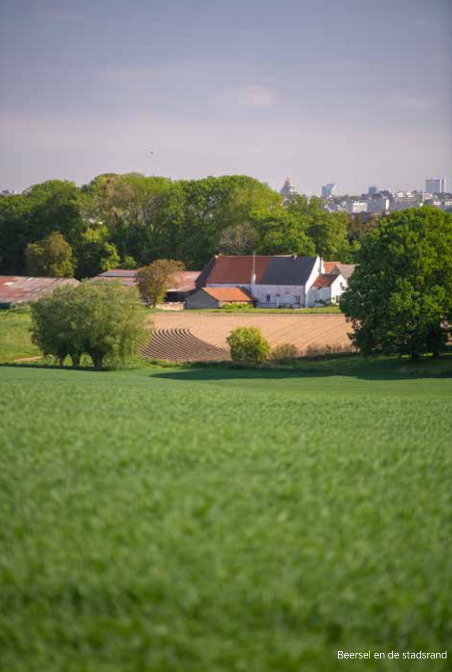
Beersel en de stadsrand