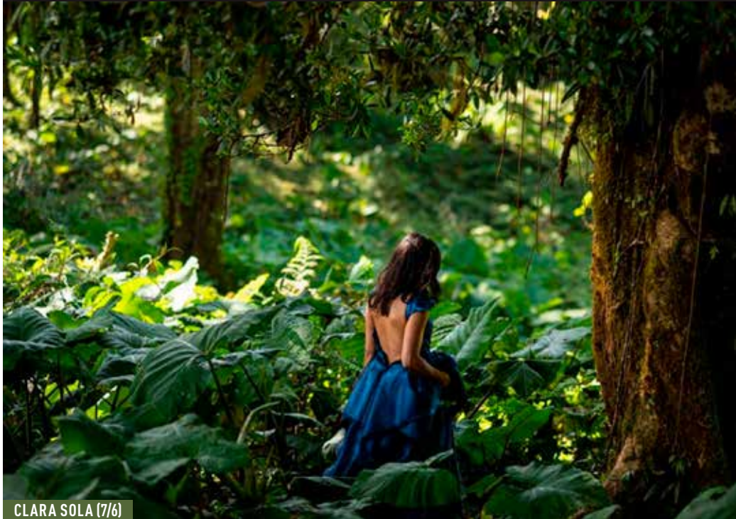
CLARA SOLA (7/6)