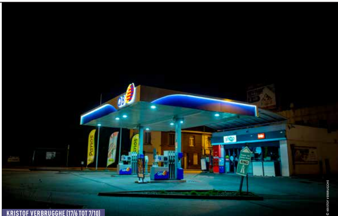
KRISTOF VERBRUGGHE (17/6 TOT 7/10)