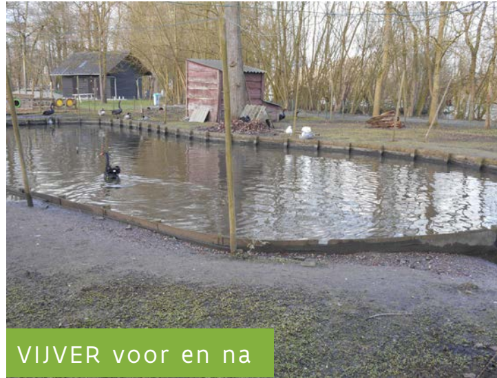
VIJVER voor en na