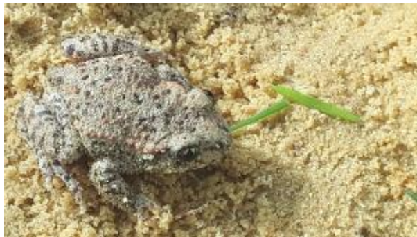
1 - Foto van de provincie Vlaams-Brabant

We planten hier een bos en houtkant aan met inheems loofhout. Op die manier herstellen en versterken we de natuurverbinding.